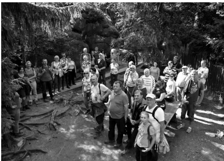
SMK na wycieczce w Górach Stołowych.