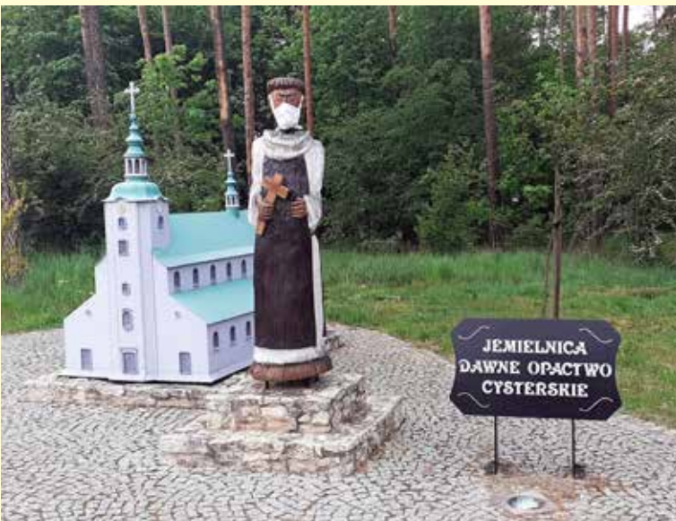
Jemielnica - opactwo.