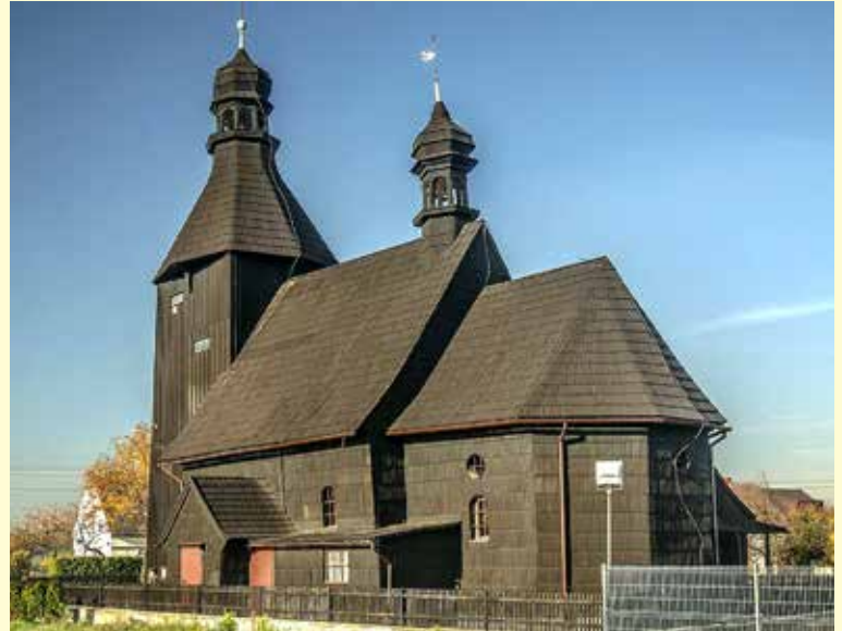
Kościół p.w. Nawiedzenia NMP i św. Jadwigi w Szczepanku.