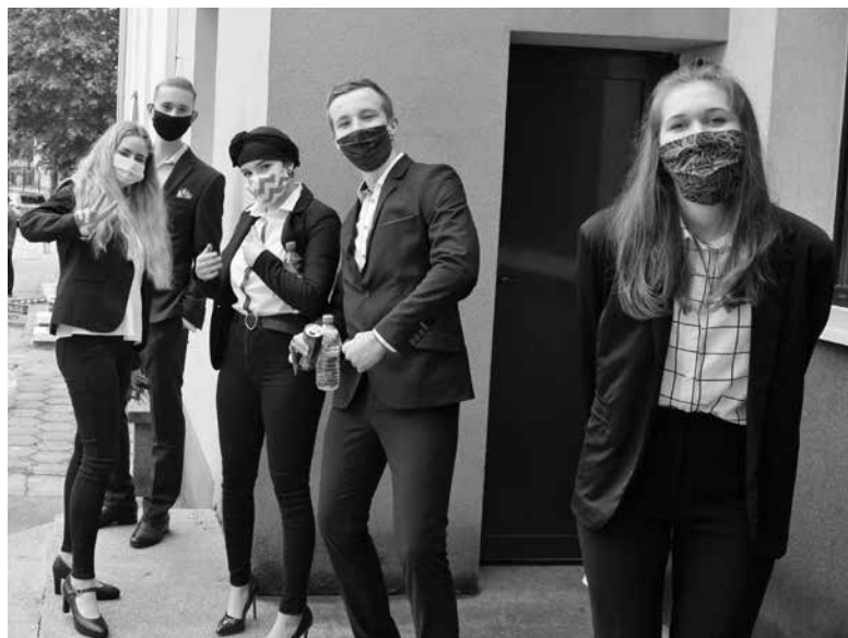
Maseczki były konieczne przez i po wyjściu z sali.

8 czerwca ozimscy maturzyści z klas liceum i technik informatycznego rozpoczęli sesję maturalną językiem polskim. W kolejnych dniach przed nimi egzaminy z matematyki i języka angielskiego. W tej sesji z przedmiotów dodatkowych największą popularnością wśród naszych maturzystów cieszyły się: matematyka, biologia, chemia, historia, wiedza o społeczeństwie, geografia i język angielski