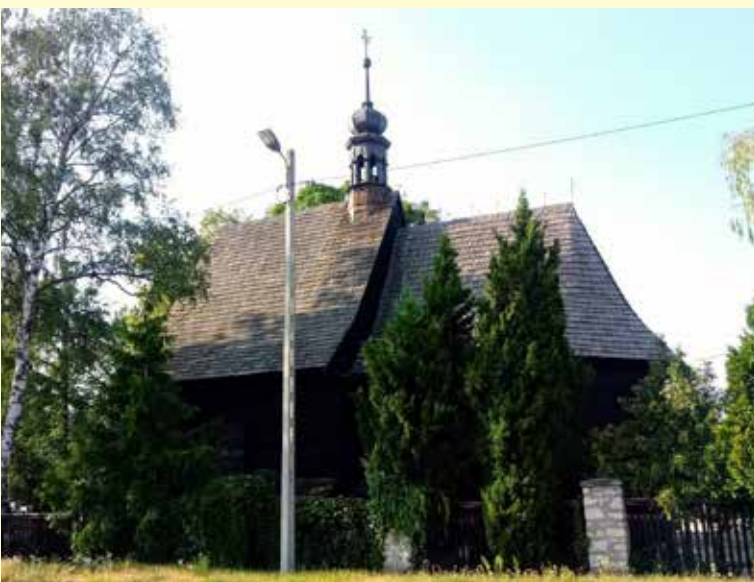
Kościół cmentarny św. Barbary w Strzelcach Opolskich.