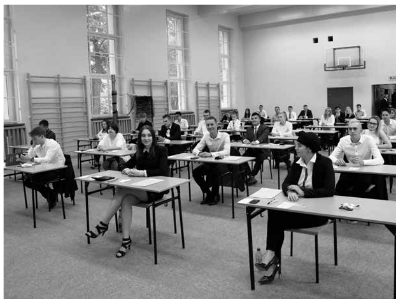
Przed egzaminem z matematyki.

Przypomnę, że absolwent przystępujący do matury obowiązkowo zdaje egzamin pisemny z trzech przedmiotów na poziomie podstawowym - języka polskiego, matematyki, języka obcego nowożytnego. Musi przystąpić do jednego egzaminu pisemnego na poziomie rozszerzonym z wybranego przedmiotu