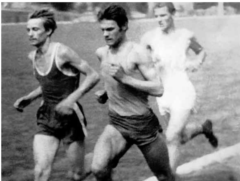
Przed metą jednego z licznych, wygranych biegów.