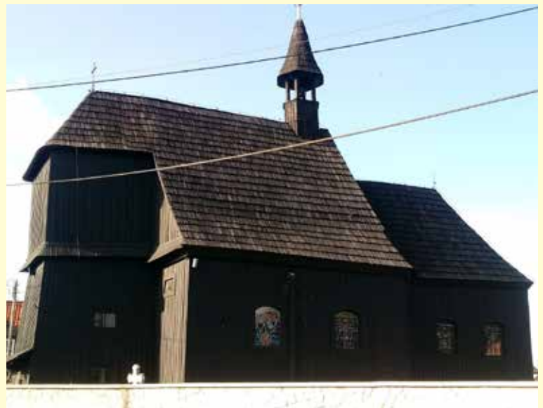
Kościół p.w. Matki Boskiej Śnieżnej w Olszowej.