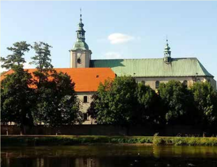
Atrakcją Jemielnicy jest pocysterski zespół klasztorny.