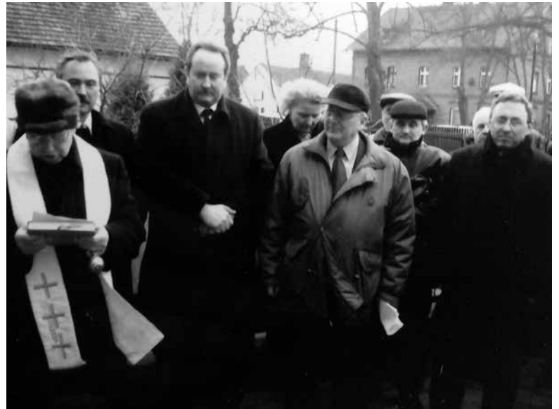
Uroczyste otwarcie w dniu 21.01.2005 r.

Przez pierwsze trzy lata działalności Muzeum odwiedziło ponad osiem tysięcy turystów z kraju i zagranicy, co było możliwe dzięki pracy