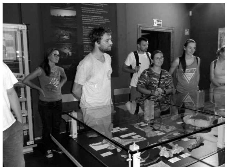
Uczestnicy międzynarodowej konferencji 3rd IMERP podziwiają okazy paleontologiczne.