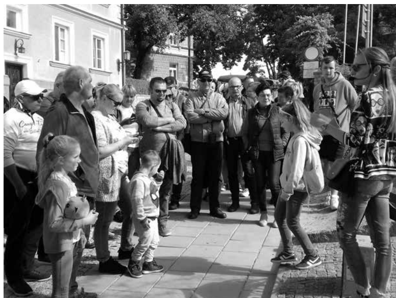
Podczas zwiedzania Sandomierza.

W niedzielę udaliśmy się do kościoła św. Jana Chrzciciela i św. Bartłomieja, który został ufundowany przez króla Kazimierza Wielkiego. Następnie odbyliśmy rejs statkiem po Wiśle. Tutaj czekała na nas niespodzianka - przez cały rejs w galowych strojach przygrywała nam kilkudziesięcioosobowa orkiestra dęta z Dobrynia, a w południe trębacz odegrał na górnym ołtarzu hejnał mariacki. Po obiedzie, wraz z przewodnikiem, spacerem Bulwarem Wiślanym udaliśmy się