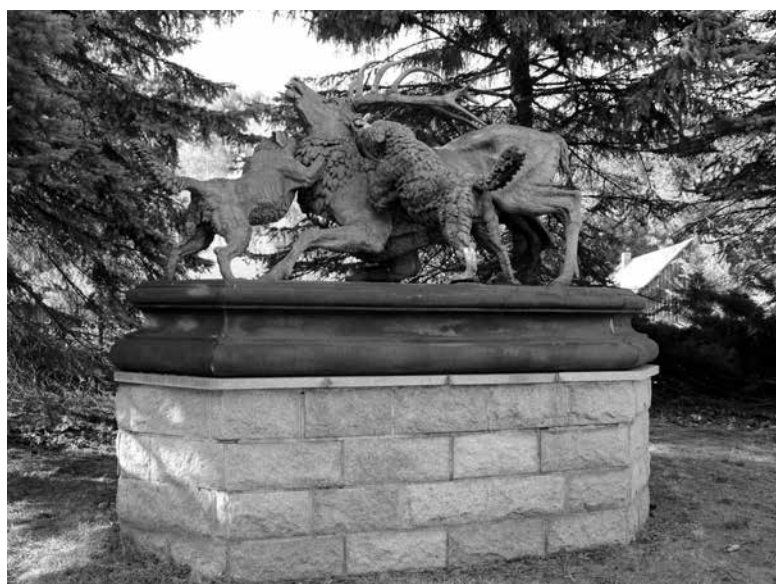
Forma żeliwna „Pokonany jeleń” w Magdesprung.