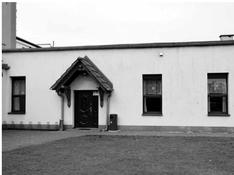
Wymiana okien w świetlicy wiejskiej w Antoniowie.