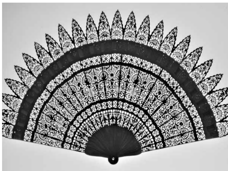
Żeliwny wachlarz zrobiony w Furst-Stolberg-Hutte, Ilsenburg.