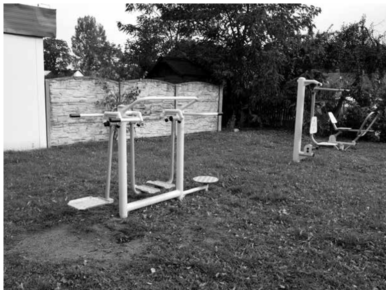
Uzupełnienie wyposażenia w siłowni plenerowej w Biestrzynniku.