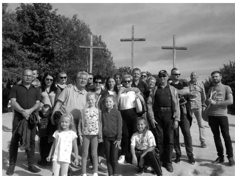
Podczas zwiedzania Kazimierza.