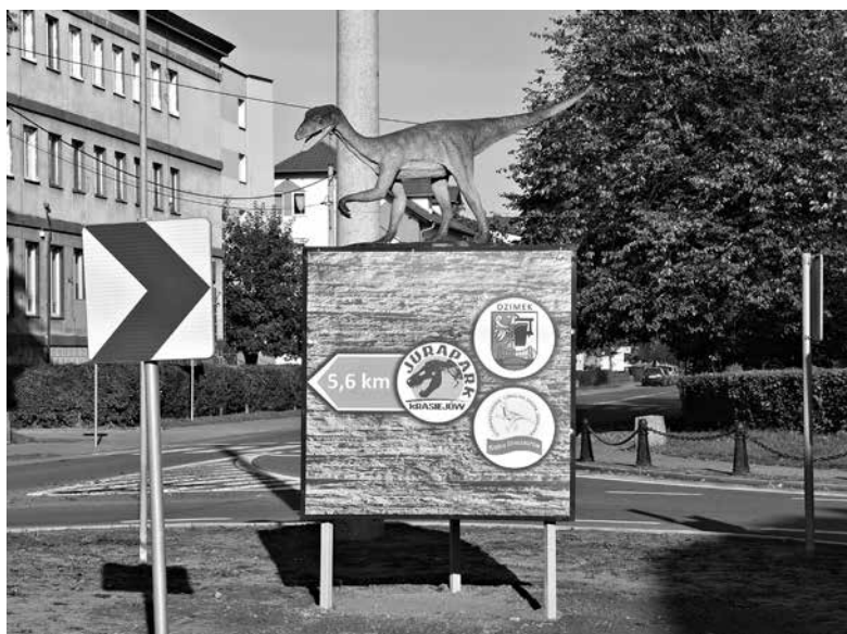
Dinozaur na rondzie w Ozimku.