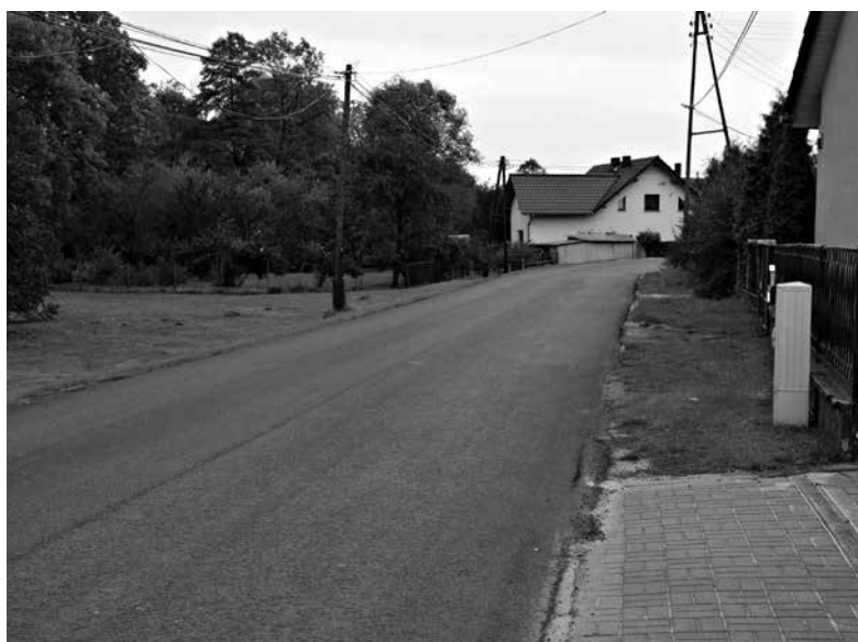
Schodnia, ul. Powstańców Śląskich.