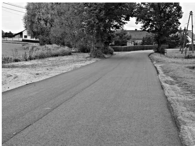
Schodnia, ul. Powstańców Śląskich.