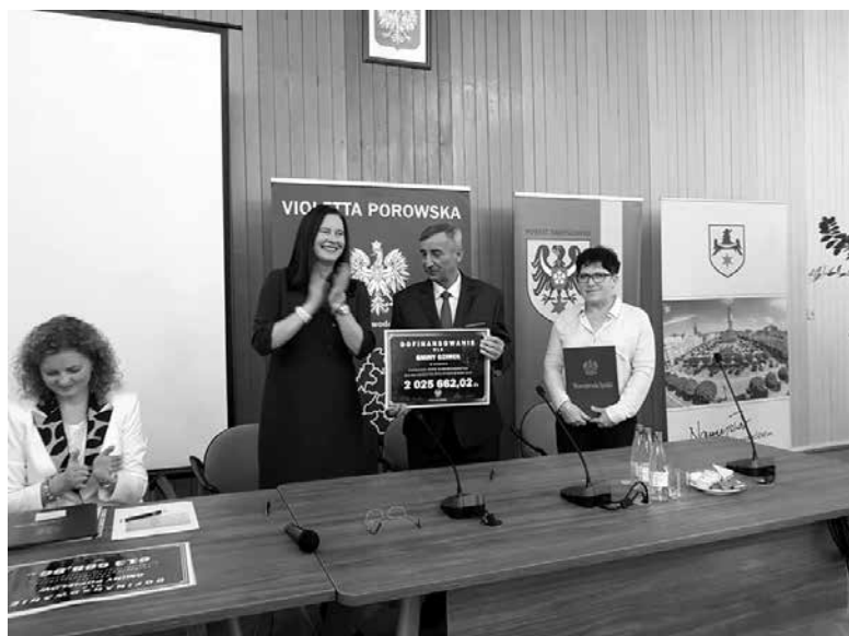
Burmistrz Ozimka po podpisaniu umowy o dofinansowaniu inwestycji.