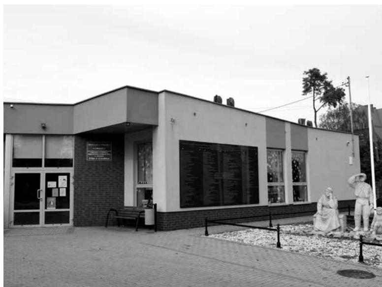
Naprawa dachu na świetlicy wiejskiej w Grodźcu.