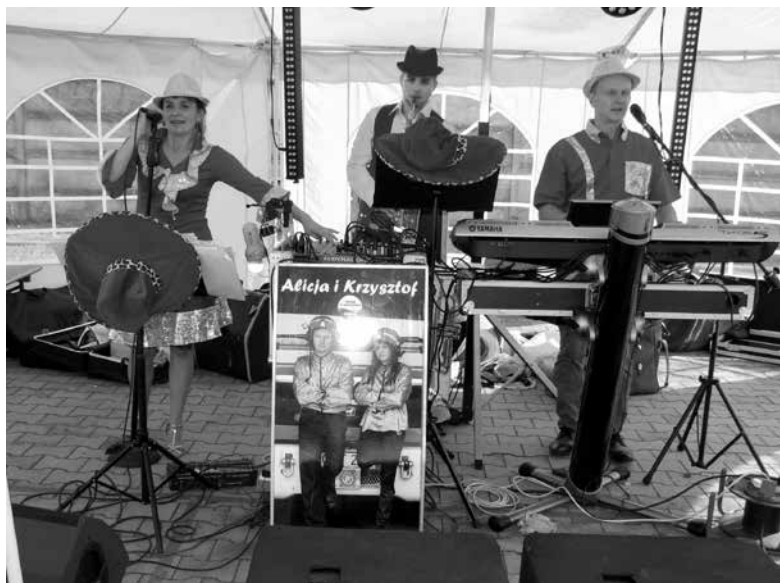
Letni festyn w Krzyżowej Dolinie.

Muzyczne popołudnie przy kołaczu i kawie kontynuowano w niedzielę. Tego dnia Koło DFK w Krzyżowej Dolinie zaprosiło swoich członków na fundowany poczęstunek, a wszystkich gości