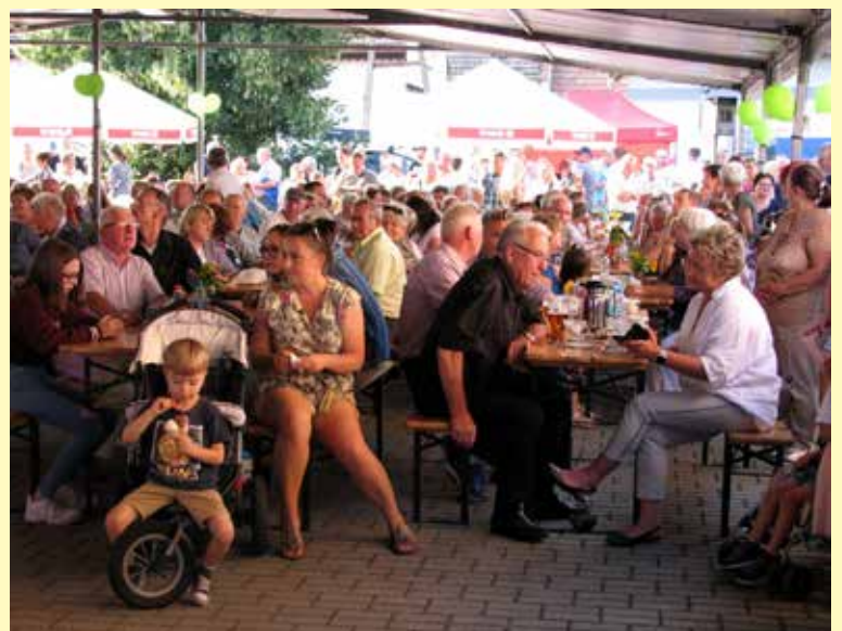
Widownia - pod namiotem.