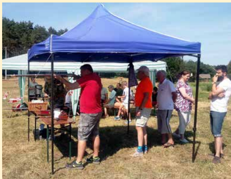
Piknik strzelecki Stowarzyszenia Dolina Małej Panwi.

Piknik zakończył się grillem i biesiadą w bardzo radosnej atmosferze, przy doskonałej pogodzie, w pięknym otoczeniu przyrody. Gratulujemy zwycięzcy i już dzisiaj zapraszamy za rok. Tegoroczny piknik został wsparty przez UMiG w Ozimku, w ramach środków na realizację zadań publicznych w zakresie kultury, tradycji i edukacji.