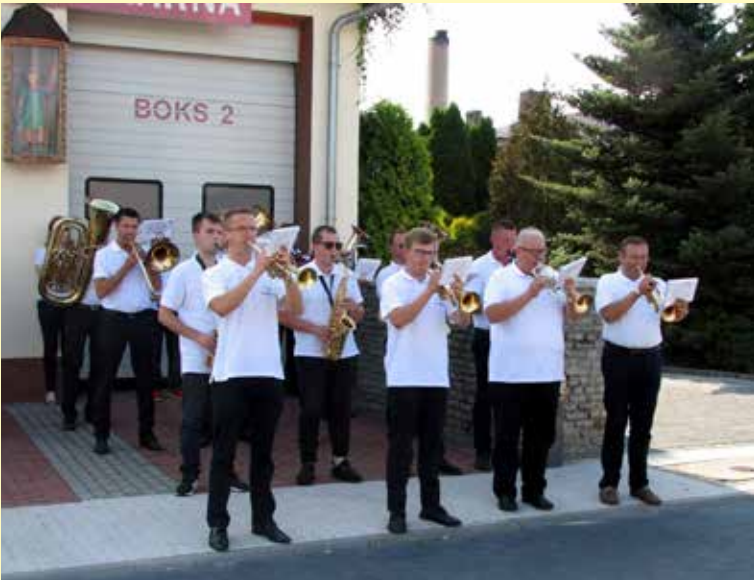
Orkiestra Dęta Szchedrzyk.