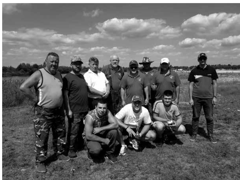
Zawody o puchar Prezesa Koła PZW Jedlice.