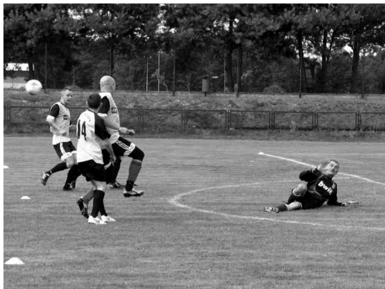
W zawodach wzięły udział drużyny oldboyów.