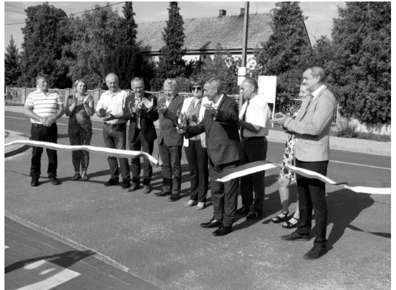
Przecięcie wstęgi w centrum Szczedrzyka.

Tradycją festynu odpustowego w Szczedrzyku jest również „Los szczęścia, czyli Szczęśliwa Niespodzianka”. Wszyscy, którzy kupili charytatywne cegiełki rozprowadzane przez wolontariuszy Caritas, otrzymywali upominki, a zarówno w środę jak i we czwartek wieczorem odbywało się losowanie „szczęśliwych niespodzianek”, czyli kilku atrakcyjnych nagród ufundowanych przez sponsorów festynu. Nie brakowało też stoisk z garmazerką, kawą i domowymi ciastami, odpustowych kramów z zabawkami i słodyczkami oraz atrakcyjnego wesołego miasteczka. Było więc wszystko, czego potrzeba do udanej zabawy całymi rodzinami.