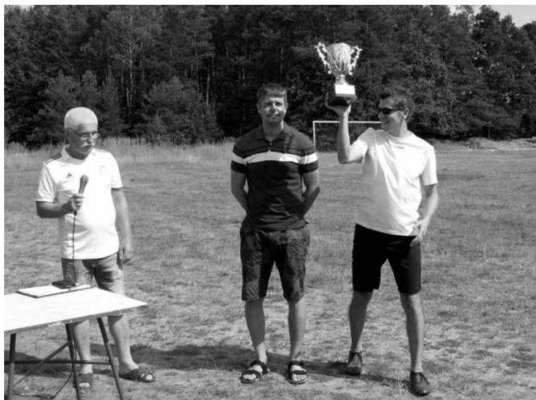
Zwycięzcy zostali nagrodzeni pucharami.