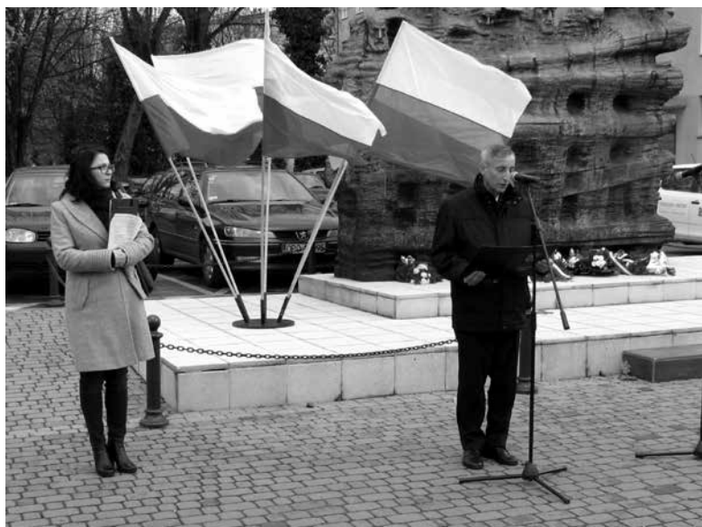
Pod pomnikiem w Ozimku.