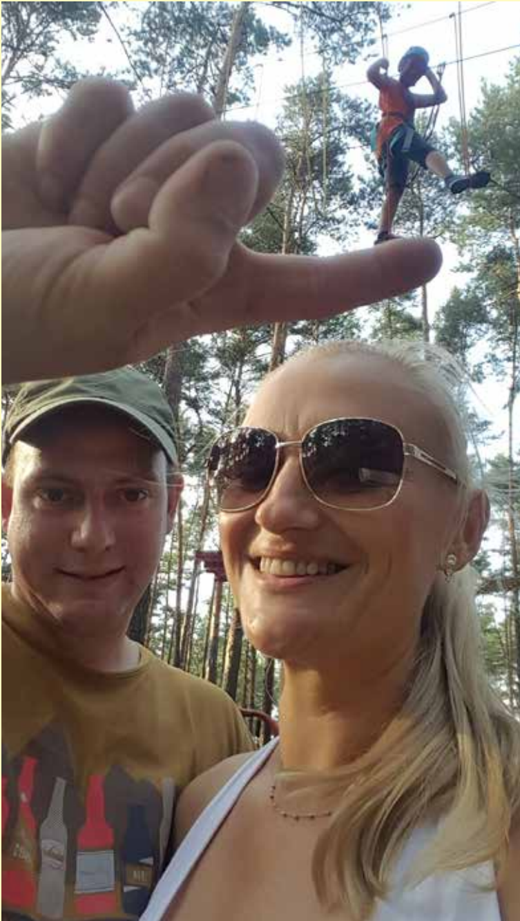
Zwycięzca w kategorii OPEN.