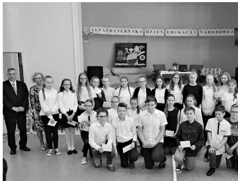
Dzień Edukacji Narodowej w PSP nr 1 w Ozimku.

14 października tradycyjnie przypada Dzień Edukacji Narodowej - święto nauczycieli i pracowników oświaty. Również w naszej gminie wszystkie szkoły obchodziły ten wyjątkowy dzień barwnymi programami artystycznymi, podczas których wręczano nagrody za zaangażowanie i sukcesy zawodowe nauczycielom oraz wyróżnienia za wybitne osiągnięcia uczniom.