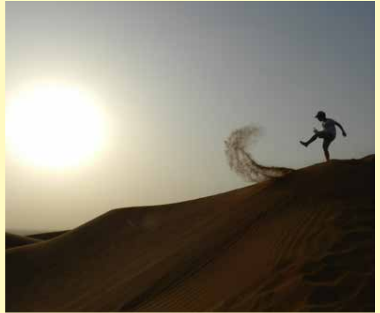
Zwycięzca w kategorii klas IV-VI.