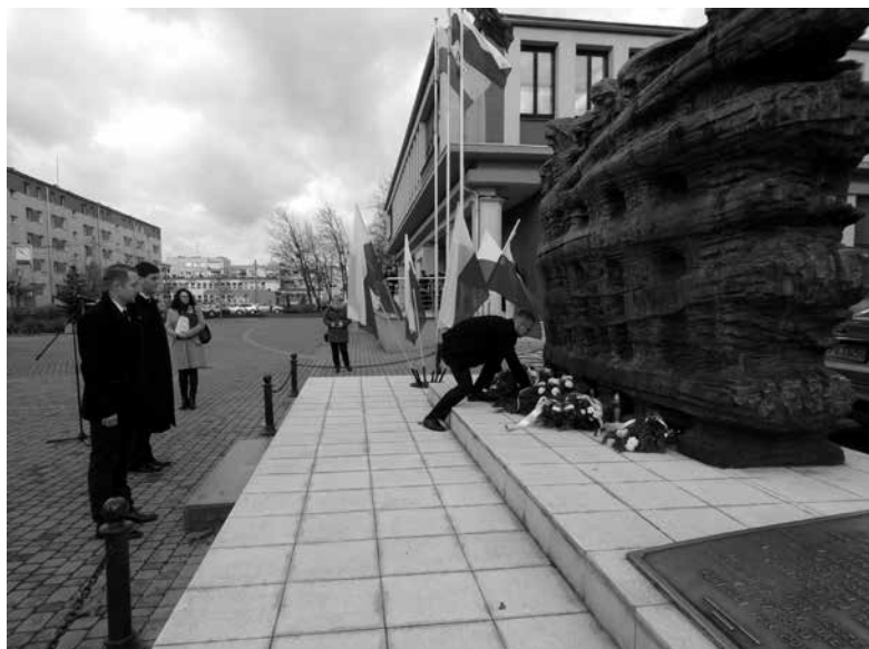
Pod pomnikiem w Ozimku.