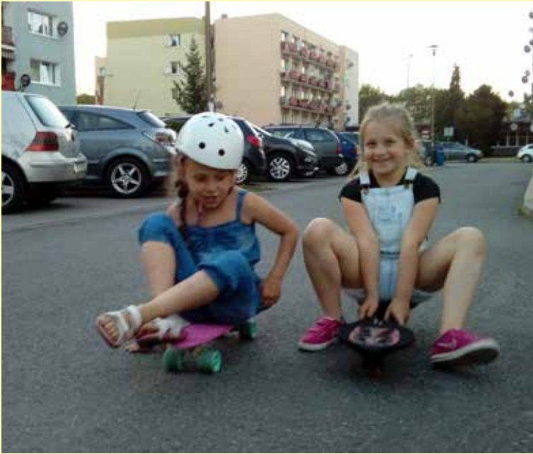
Zwycięzca w kategorii klas I-III.