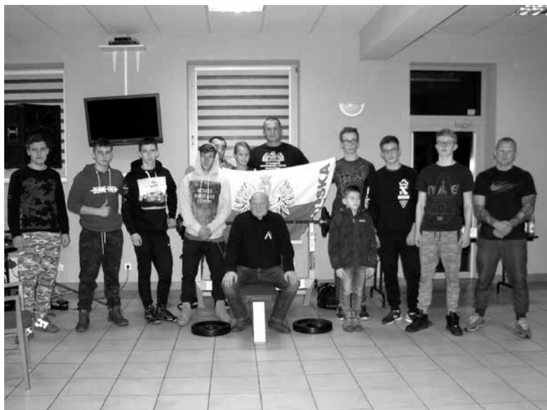
Wielokrotne wyciskanie sztangi.