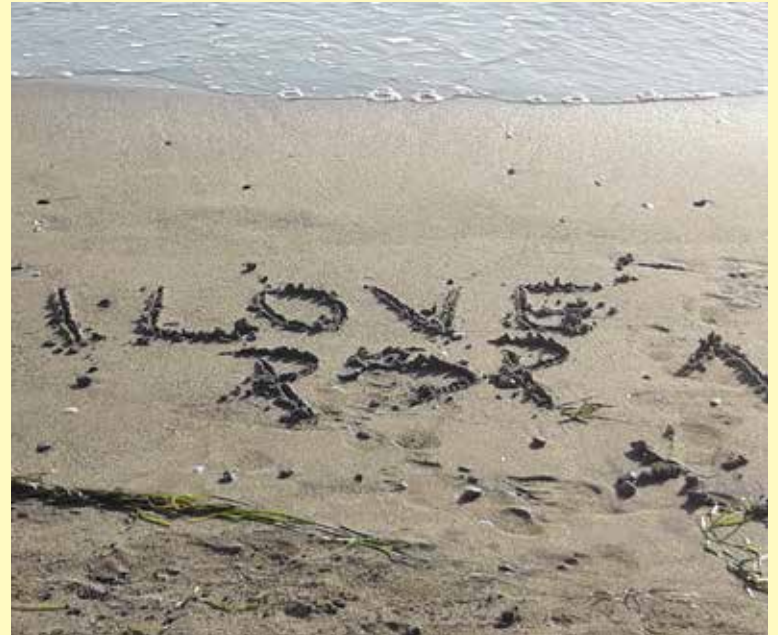
Wyróżnienie w kategorii OPEN.