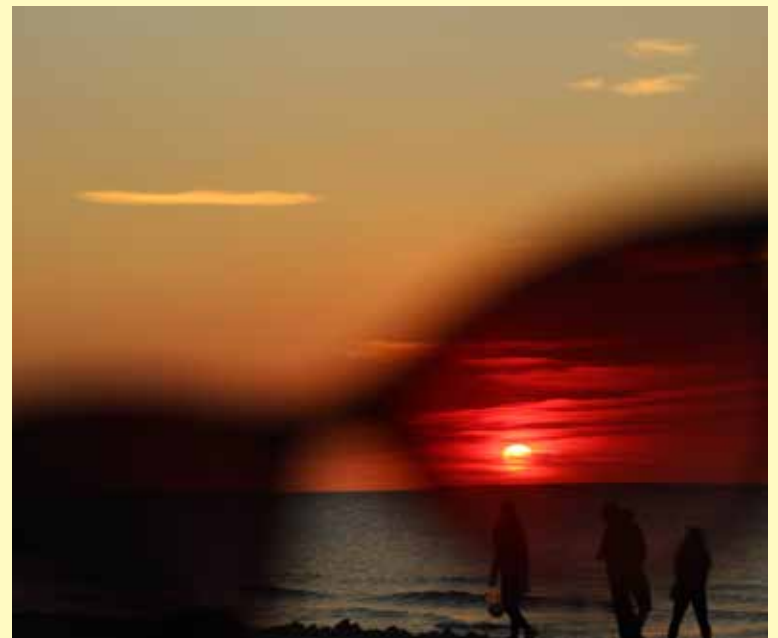
Wyróżnienie w kategorii OPEN.