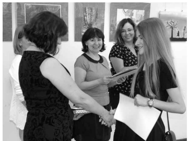
Wernisaż wystawy absolwentów „Cisza i ogień”.