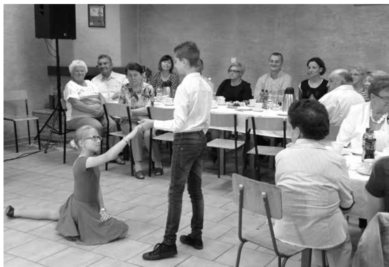
Niedziela Mniejszości Niemieckiej w DFK Szczedrzyk.