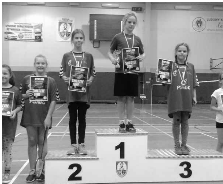
Dziewczyny z gminy Ozimek na zawodach wojewódzkich w badmintonie.

Pomimo okresu świąteczno-noworocznego, uczniowie z gminy Ozimek brali udział w licznych zawodach sportowych, zorganizowanych na przełomie grudnia ubiegłego i stycznia tego roku.