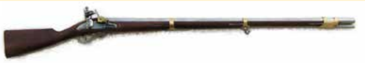
Nowy Pruski Muszkiet M1809 produkowany w Królewskiej Hucie Malapanie w Ozimku.