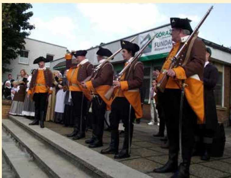
Grupa rekonstrukcyjna Strzelców Hutniczych w czasie obchodów Święta Mostu i Żeliwa.