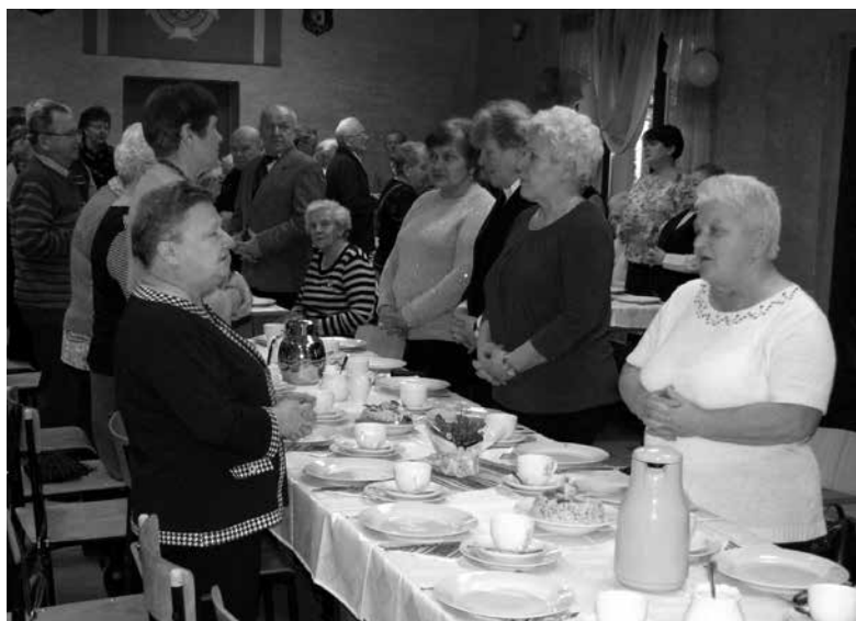
Dzień Chorego w Szczedrzyku.