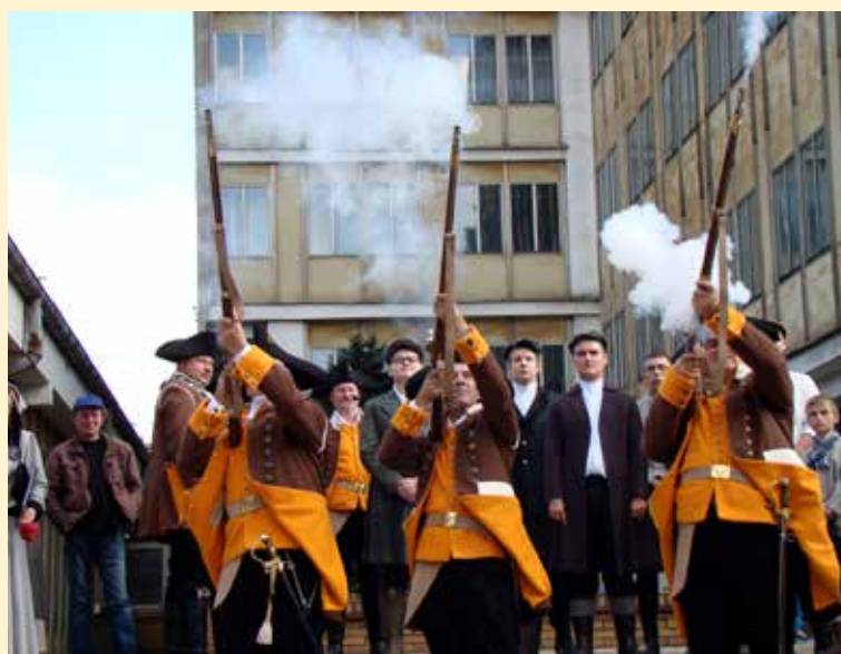
Strzelcy Hutniczy oddają salwę honorową z replik muszkietów M1809.