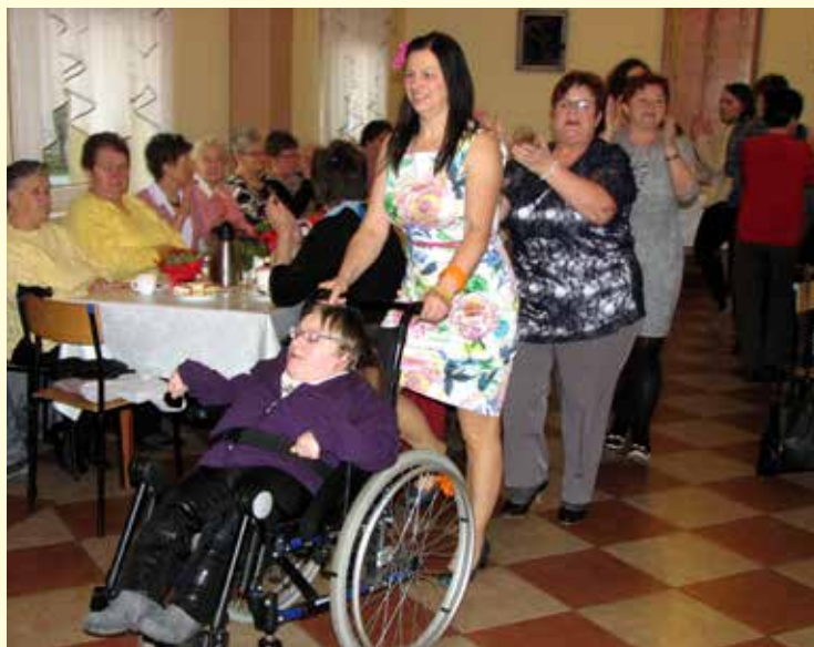
Panie z Biełżyznika świętowały Dzień Kobiet.