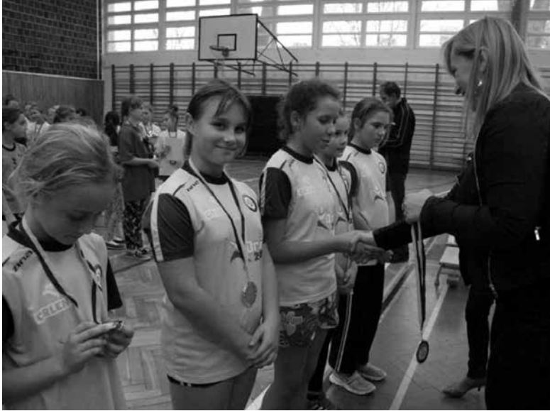
Uczennice SP nr 3 zostały mistrzyniami województwa w dwa ognie.

W listopadzie i grudniu kontynuowane były rozgrywki w halową piłkę nożną i ręczną, w których uczestniczyli uczniowie szkół podstawowych i gimnazjalnych naszej gminy. Odbił się również finał wojewódzki w dwa ognie, zakończony sukcesem uczennic GZS - SP nr 3 w Ozimku, które zdobyły mistrzostwo województwa opolskiego.