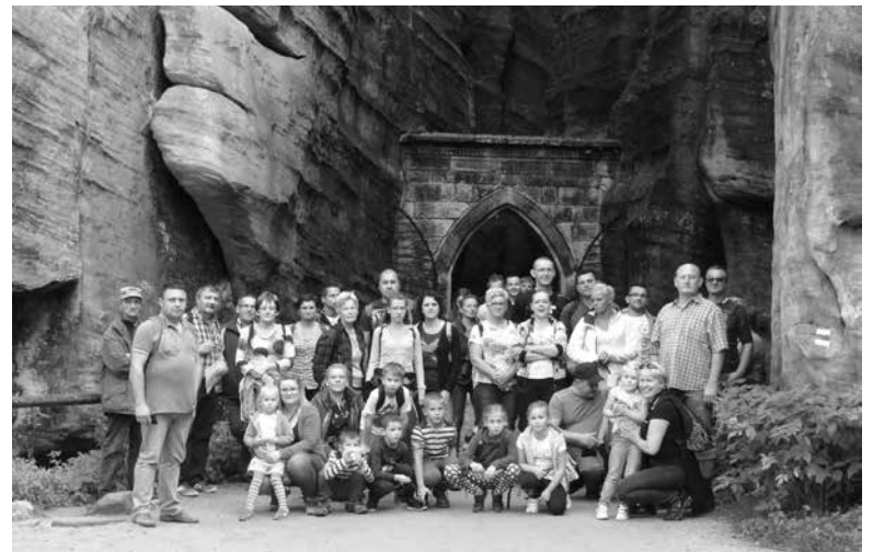
Na wycieczce w Górach Sowich.