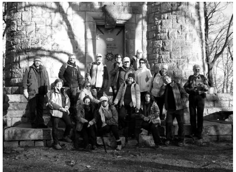
... na Ślęży.

W tym roku KTG „Kozica” zorganizował 20 imprez turystyki kwalifikowanej i krajoznawczej. Odbyło się 14 wycieczek jednodniowych w góry polskie i czeskie oraz znane i atrakcyjne miejsca turystyczno-krajoznawcze. Zorganizowaliśmy również jednodniowy spływ kajakowy rzeką Mała Panew na trasie Zawadzkie - Staniszcze Wielkie. Najważniejszą imprezą był jubileuszowy - L Rajd Górski Hutników w Bieszczady z bazą w Wetlinie. Brała w nim udział rekordowa liczba - 58 turystów. Kolejną pięciodniową imprezą był rajd „Tatrzańska jesień” z bazą w ośrodku wypoczynkowy w Poroninie. Jak co roku, cieszył się on dużym zainteresowaniem. W sierpniu odbył się rajd po Czeskiej Szwajcarii. Zwiedzaliśmy też kolejne europejskie stolice - tym razem nadbałtyckie: Wilno, Rygę i Tallin. Wycieczka cieszyła się