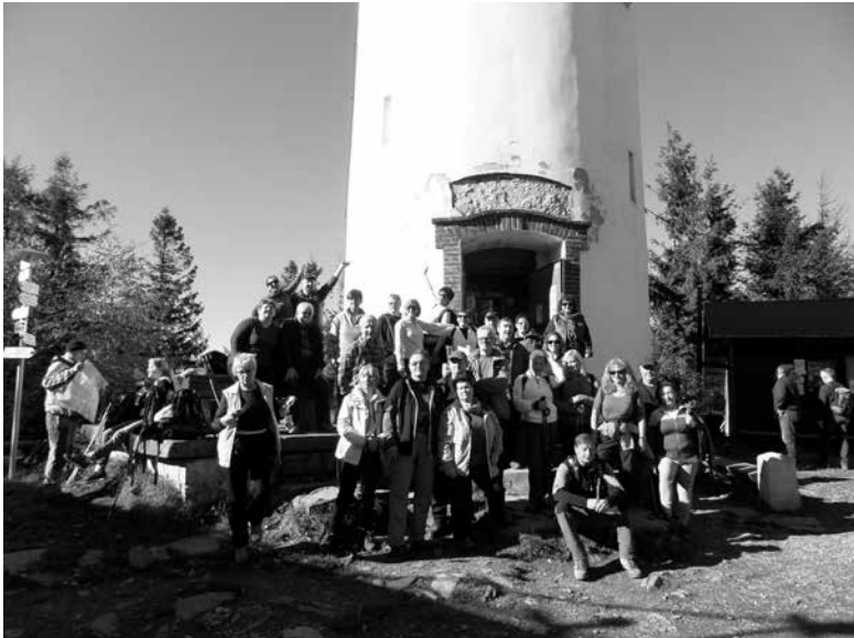
Zakończenie sezonu turystycznego na Biskupiej Kopie oraz ...

O pełny miesiąc został w tym roku wydłużony sezon w KTG „Kozica”, a jego zakończenie odbyło się w dwóch etapach. Tradycyjnie - 24 października w Górach Opawskich, a oficjalnie - wycieczką andrzejkową na Ślężę w dniu 28 listopada.