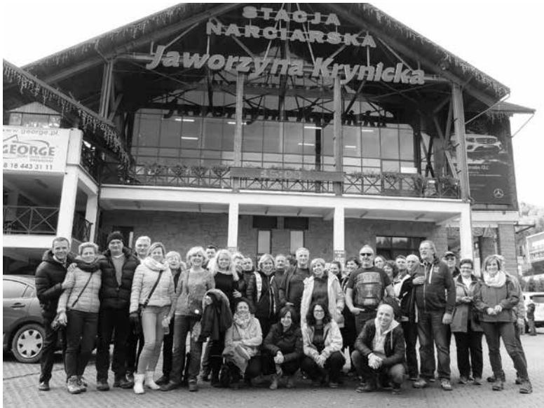
Na wycieczce w Krynicy Górskiej.

W dniach 17-18 października członkowie ozimskiej sekcji motorowej wzięli udział w wycieczce turystyczno-krajoznawczej do Krynicy Górskiej, Piwnicznej i Starego Sącza.