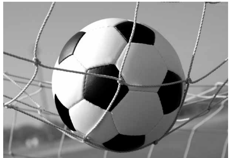
Na piłkarskie emocje musimy poczekać do wiosny.