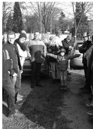
Samochodowy rajd andrzejkowy.

Od maja do listopada jeździli na rowerach członkowie Sekcji Rowerowej Cyklista, działającej przy Stowarzyszeniu Nasz Grodziec.