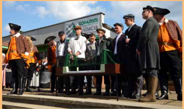
7. Młodzi adepci hutnictwa, „młode lisy”, opowiedzieli o budowie mostu.