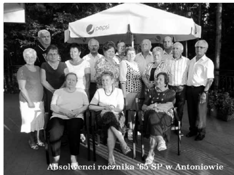
Absolwenci rocznika '65 SP w Antoniowie

Absolwenci rocznika '65 SP w Antoniowie serdecznie dziękują swojej Wychowawczyni i Nauczycielkom za uświetnienie spotkania swoją obecnością.