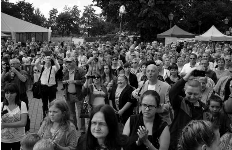
10. Inscenizacja historyczna zgromadziła tłumy widzów i przedstawicieli mediów.

Serce człowieka, sercem miasta. Kraków ma rynek z pomnikiem „Adasia”, Warszawa „Syrenkę”, Gdańsk Długi Targ z „Neptunem”, a my mamy Most. Nie taki zwykły jakich są tysiące, my mamy Most wyjątkowy, najstarszy na świecie, wiszący most żelazny, dowód kunsztu ozimeckich hutników i mistrza Carla Schotteliusa. Mamy się czym chwalić. Parafrazując słowa wieszczka: Niechaj narodowie wždy postronni znają, iż w Ozimku najstarszy na świecie wiszący most żelazny mają.