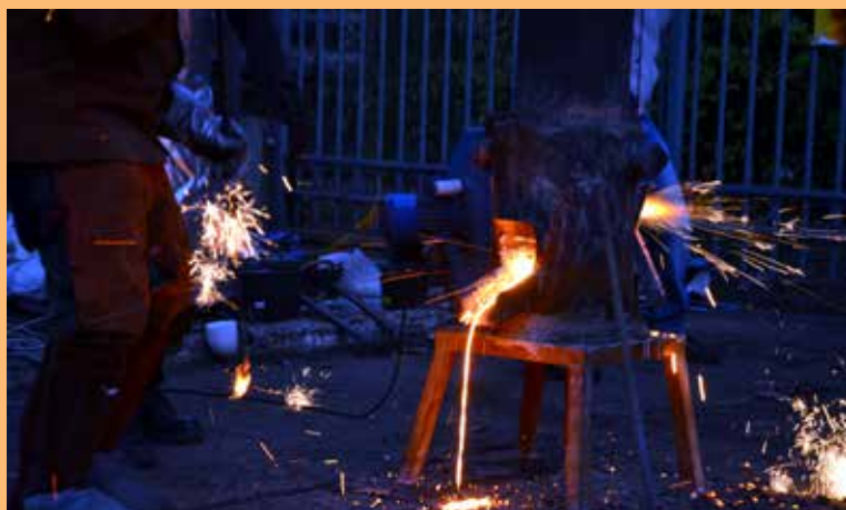
20. ... a nawet samodzielnie przygotować formy do wieczornego odlewania żeliwa.