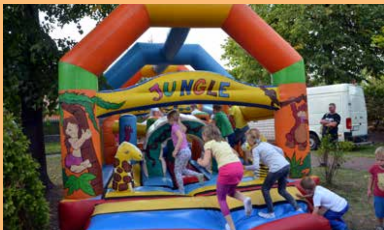
18. Przygotowano wiele atrakcji także dla dzieci. Mogły się nie tylko bawić, ...