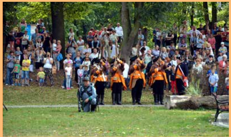
14. Bitwa zgromadziła ponownie tłumy widzów.