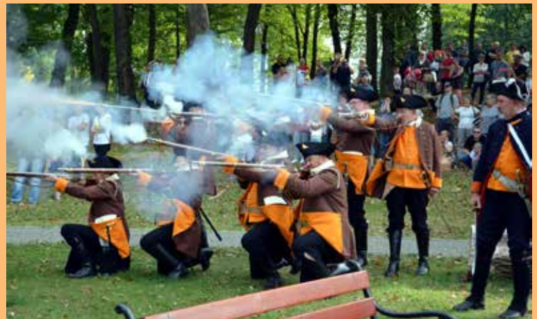
15. Wśród huku armat i wystrzałów bitwa przetoczyła się od kościoła ewangelickiego do mostu.