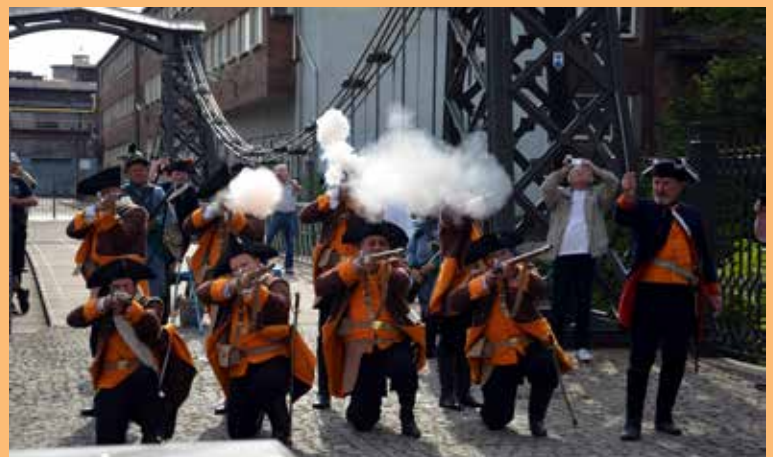
17. Ostatecznie jednak strzelcom hutniczym most udało się obronić.