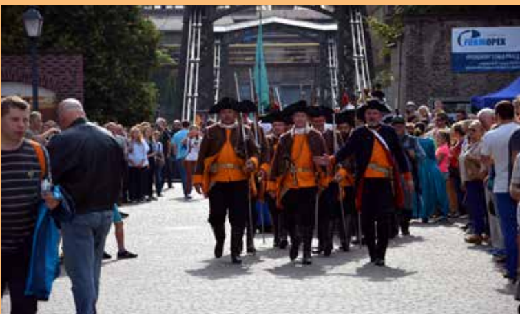
13. Niedzielny wymarsz strzelców hutniczych na „Bitwę o Most”.