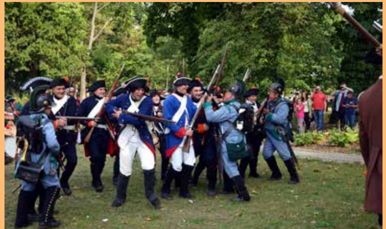
16. Początkowo pruskie regimenty z kozielskiej twierdzy nacierały, odnosząc kolejne zwycięstwa i wypierając strzelców hutniczych w kierunku mostu.