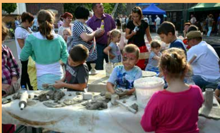
19. ... ale także w zabawie się uczyć, ...