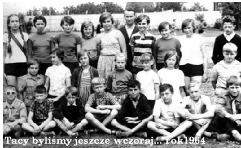
Tacy byliśmy jeszcze wczoraj... rok 1964

W ostatni weekend sierpnia uczniowie rocznika 1958-65 Szkoły Podstawowej w Antoniowie obchodzili swój piękny jubileusz.