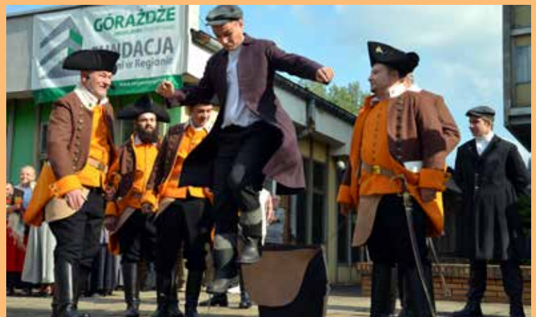
8. Skokiem przez skórę i pasowaniem zostali przyjęci do hutniczego stanu.