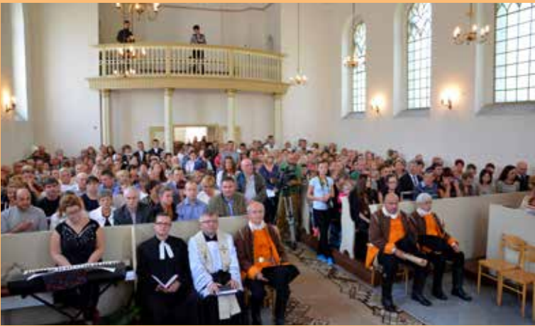
1. Nabożeństwo wypełniło kościół ewangelicki do ostatniego miejsca.