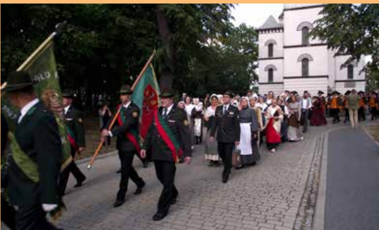
4. Historyczny korowód przemaszerował ulicami miasta w towarzystwie orkiestry dętej i pocztyw sztandarowych.