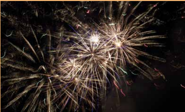
12. Wieczorem zgromadzonych na uroczystości zachwycił pokaz sztucznych ogni.