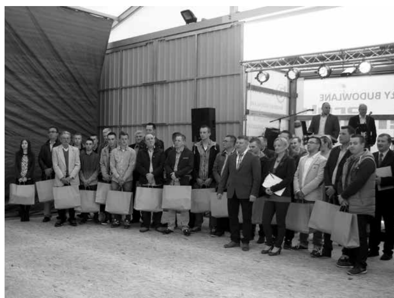
Właściciele firmy ze swoimi pracownikami.