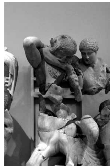
Pojedynek herosa z bykiem króla Minosa w Muzeum Archeologicznym.