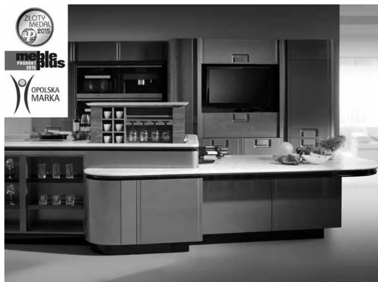
Kuchnia Roma otrzymała nagrodę „Opolska Marka 2014”.