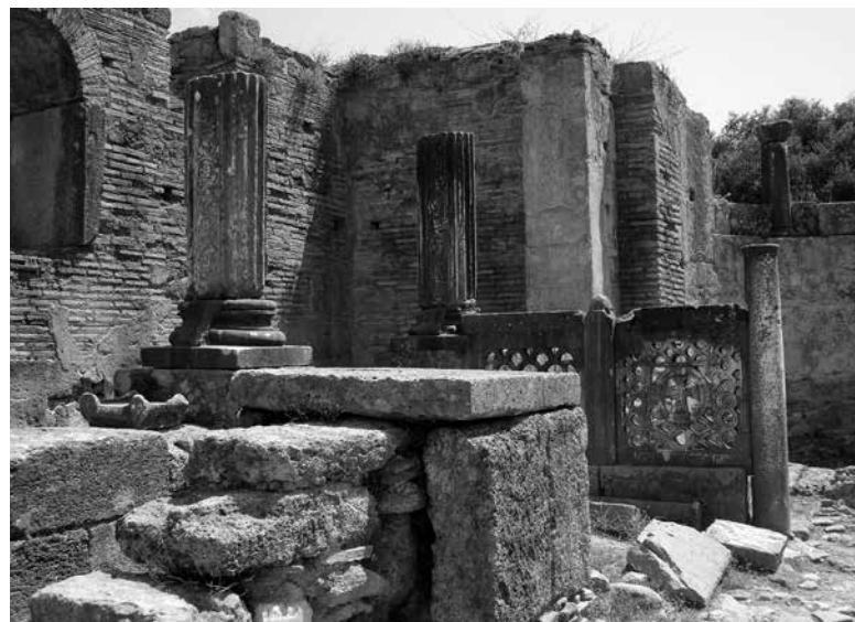
Pracownia Fidiasza na terenie stanowiska archeologicznego w Olimpii.

Olimpia to miasto w Grecji na Półwyspie Peloponez. W starożytności było to najsłynniejsze miejsce kultu Zeusa. U stóp wzgórza Kronosa znajdowało się sanktuarium poświęcone Zeusowi, wokół którego, co 4 lata odbywały się igrzyska, zwane od tego miejsca olimpijskimi. Pierwsze odnotowane igrzyska odbyły się w 776 p.n.e.