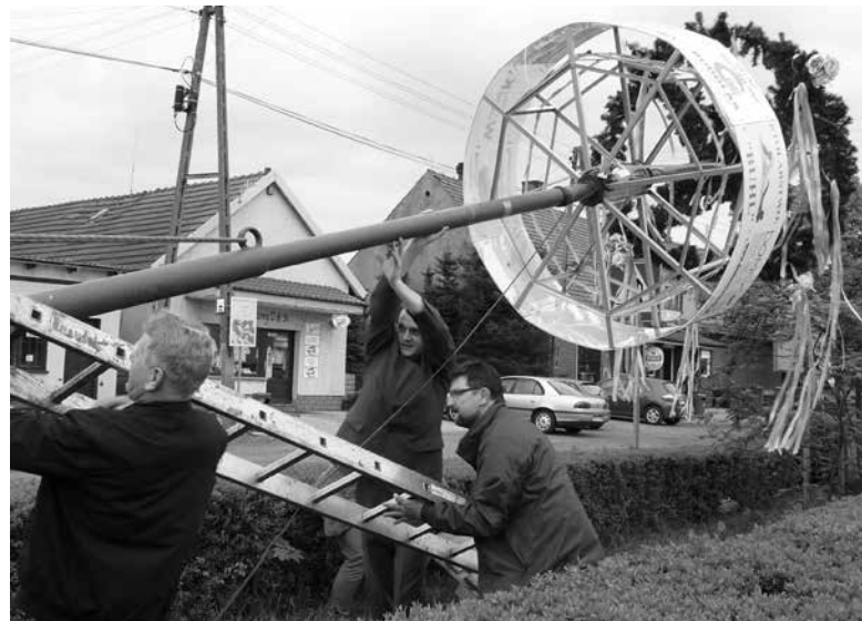
Stawianie drzewka majowego w Szczedrzyku.

Przełom kwietnia i maja to dla mieszkańców Szczedrzyka okazja, żeby spotkać się przy stawianiu drzewka majowego. Ta piękna, łącząca lokalne społeczności tradycja, ma długą historię. Jak się sądzi, jest pozostałością znanego w całej Europie, dawnego kultu drzew. Najstarsze przekazy o drzewku majowym pochodzą ze średniowiecza.