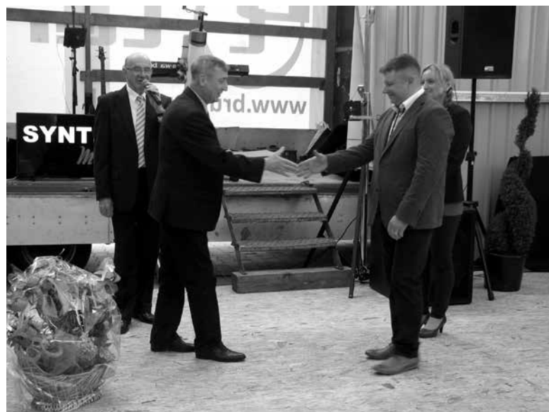
10-lecie firmy A.D.I.