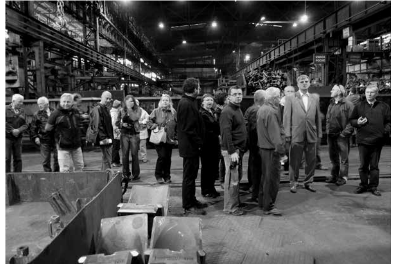
Konferencja hutnicza - 2012 r.

Stowarzyszenie LGD „Kraina Dinozaurów” jest jedną z dwunastu Lokalnych Grup Działania, które działają na terenie Opolszczyzny. Obszar działania LGD „Kraina Dinozaurów” to siedem gmin: Chrzastowice, Dobrodzień, Kolonowskie, Ozimek, Turawa, Zawadzkie, Zębowice, z trzech różnych powiatów - oleskiego, opolskiego i strzeleckiego.