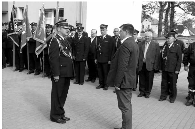
80-lecie OSP Dylaki.