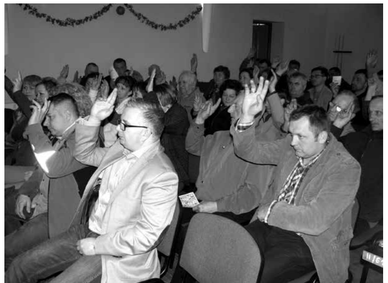
Zebranie wiejskie w Krzyżowej Dolinie.