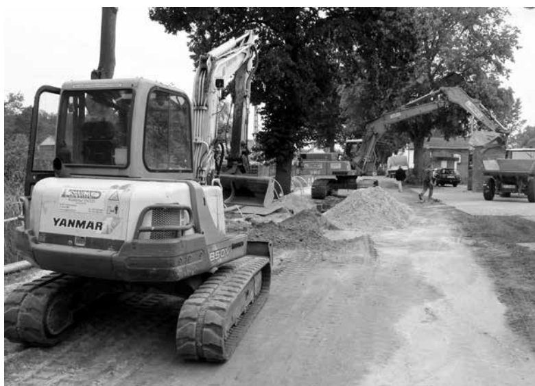
Takie były początki.