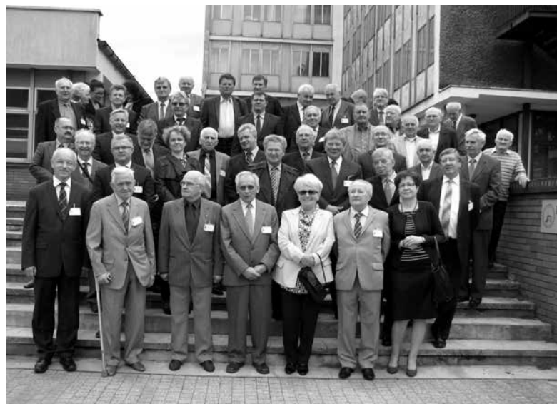
Spotkanie byłych dyrektorów Huty Małapanew.

Chociaż w rozwieszonych na terenie Ozimka plakatami Stowarzyszenie Dolina Małej Panwi zastrzegło, że nie pretenduje do miana głównego organizatora obchodów 260-lecia Huty Małapanew, to jednak zorganizowana przez nie uroczystość była de facto jedynym akcentem, przypominającym o tym ważnym jubileuszu. 9 maja w Muzeum Hutnictwa Doliny Małej Panwi odbyło się spotkanie byłych dyrektorów zakładu z lat 1964-2012. W zamierzeniu organizatorów miało ono być pomostem między historią a współczesnością Huty Małapanew i środowiska, które przez lata kształtowała. Liczny udział gości poświadczył, że zamiar organizacji takiego spotkania był bardzo trafiony.