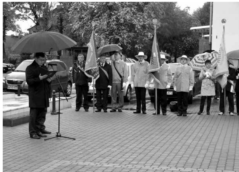
Obchody Święta Konstytucji w Ozimku.