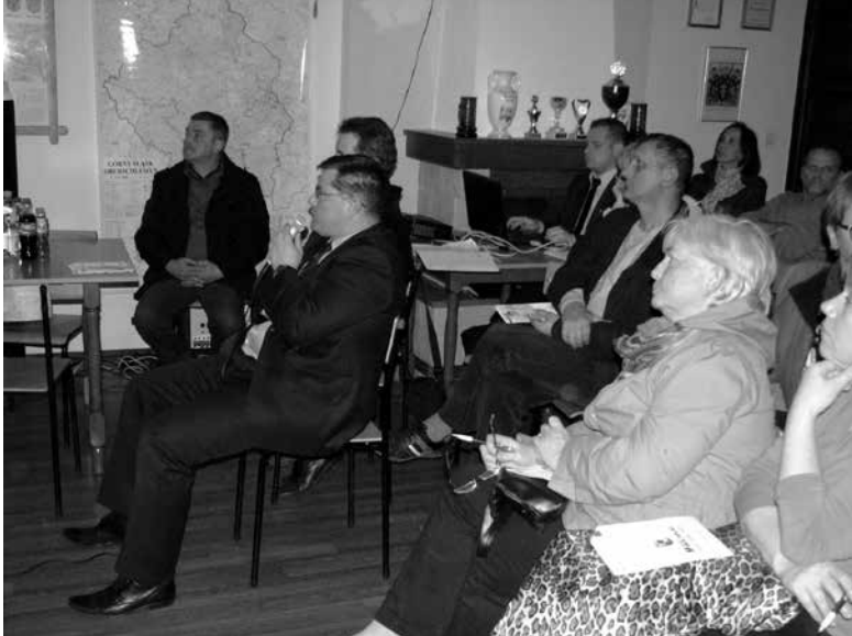
Zebranie wiejskie w Krasiejowie.