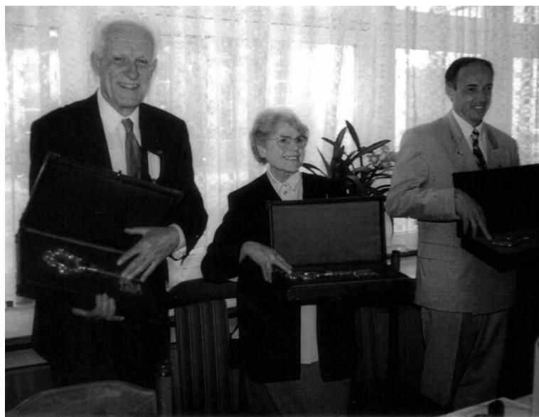
Nadanie tytułów „Honorowy Obywatel Miasta Ozimka” w dniu 24 maja 1999 r.