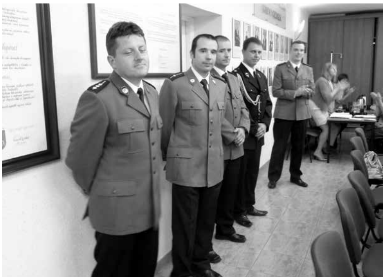
Uczestnicy akcji ratowniczej otrzymali podziękowania.