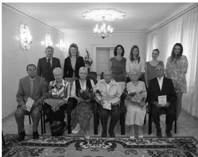
Jubilaci godów małżeńskich.