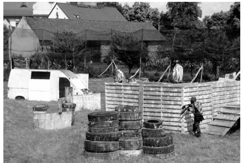
III Paintballowy Turniej Ozimski.

w Polsce. Sędziowali zawodnicy drużyny Biedroneczki Paintball Team, na czele których stał sędzia