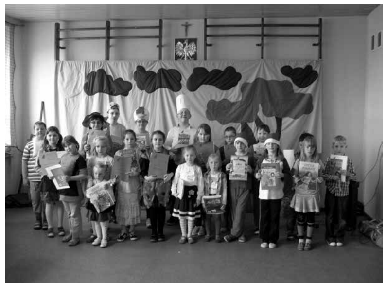
Uczestnicy i laureaci konkursu recytatorskiego.