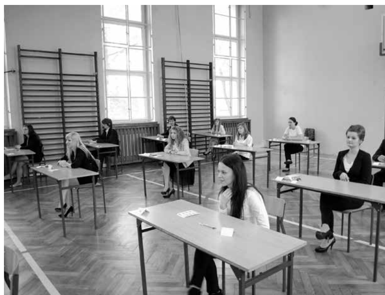
Na sali egzaminacyjnej.