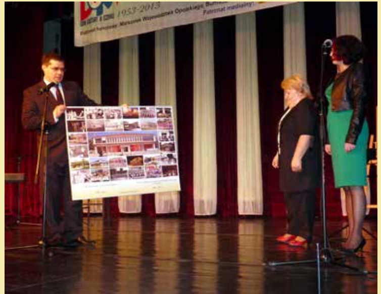
Fotoreportaż z jubileuszu.

Pod znakiem obchodów 60-lecia Domu Kultury i 50-lecia Miejskiej i Gminnej Biblioteki Publicznej upłynął również w Ozimku świąteczny weekend 1-3 maja. Niestety, bardzo brzydka pogoda spowodowała, że na odbywające się pod Domem Kultury imprezy przyszło znacznie mniej publiczności, niż oczekiwali organizatorzy. W deszczu mokło wesołe miasteczko, a występy oglądało niewielu widzów. Dopiero koncert Eneja zgromadził pod sceną wielu fanów zespołu, ale był już ko-