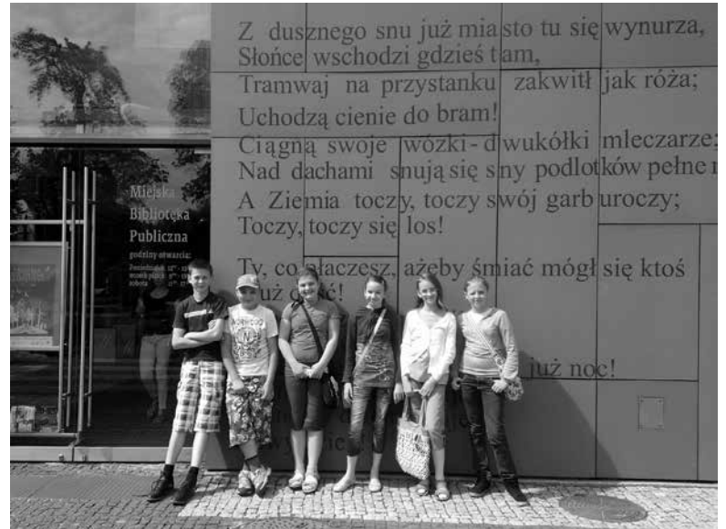
Z wizytą w Miejskiej Bibliotece Publicznej.