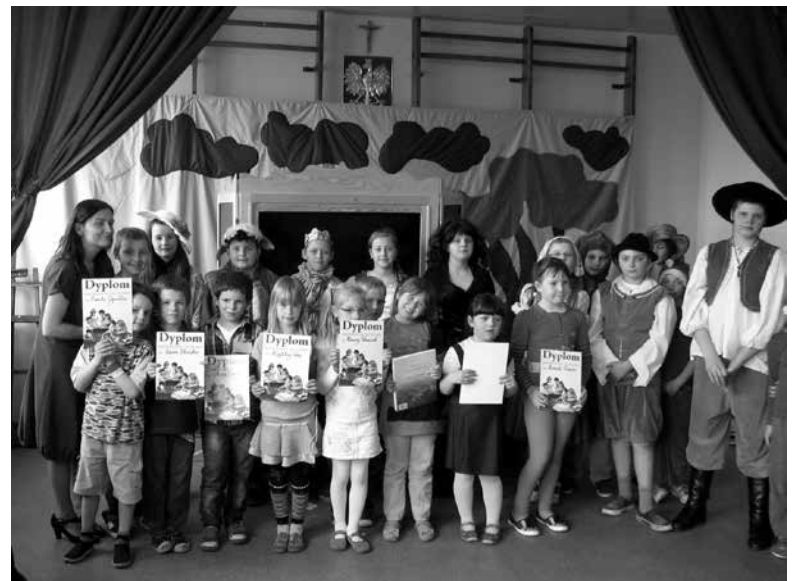
Pasowanie pierwszaków na czytelników.