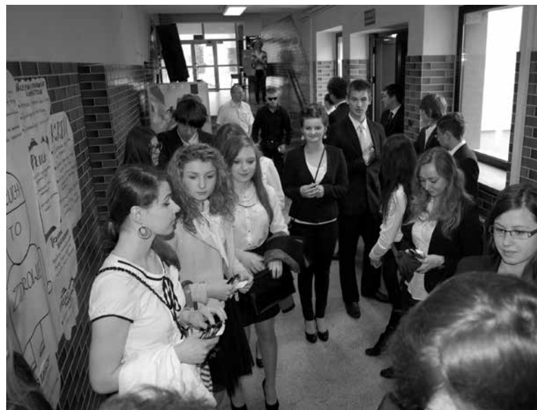
Oczekiwanie przed maturą.

Początek maja w Zespole Szkół w Ozimku to czas egzaminów maturalnych. W tym roku szkolnym do matury przystąpiła jedna klasa liceum ogólnokształcącego. Egzamin dojrzałości rozpoczął się tradycyjnie językiem polskim, który w tej sesji egzaminacyjnej był zdawany 7 maja.