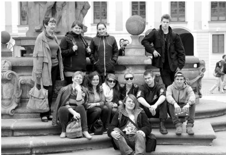
Na projekcie w Pradze.