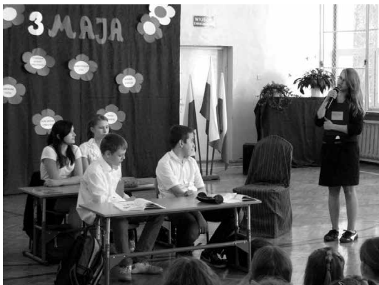
Święto Konstytucji w PSP Szczedrzyk.