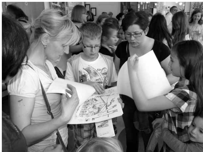
Wernisaz wystawy „Pejzaż pokoleń”.