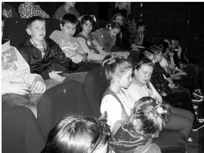
Z wizytą w teatrze.