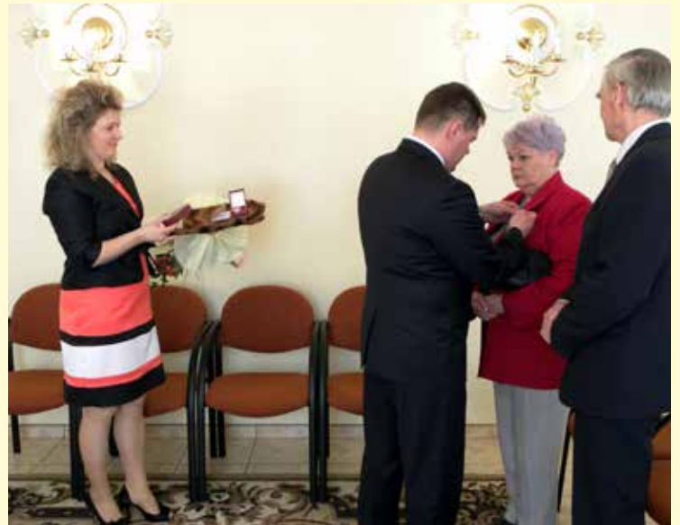
Jubilaci otrzymali z rąk Burmistrza Ozimka medale.