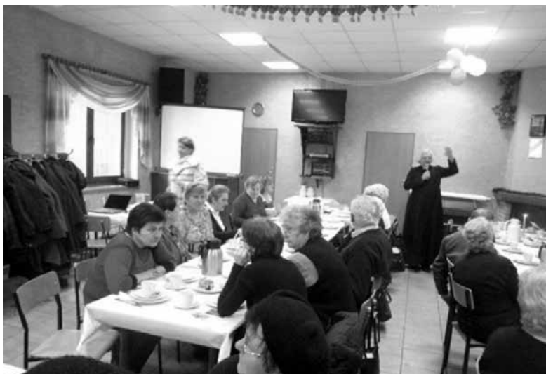
Świątowy Dzień Chorego w Szczedrzyku.

Od 1993 roku kościół katolicki na całym świecie obchodzi w dniu 11 lutego - w święto Matki Bożej z Lourdes - Świątowy Dzień Chorego.