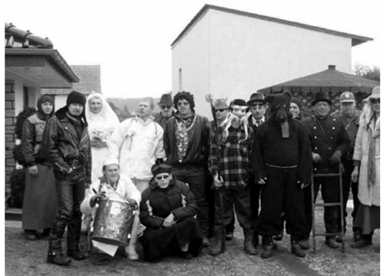
Wodzenie niedźwiedzia w Krzyżowej Dolinie.