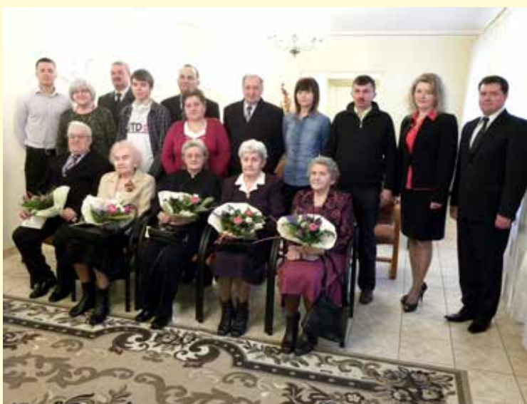
Jubilaci urodzinowi w towarzystwie rodzin i znajomych.