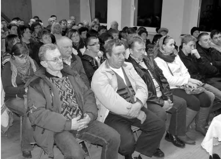
Zebranie wiejskie w Pustkowie.

Zebranie wiejskie w Pustkowie odbyło się 12 marca przy dużej frekwencji mieszkańców, którzy przyszli, aby dowiedzieć się o zmianach związanych z odbiorem odpadów komunalnych, jakie nastąpią od 1 lipca br.