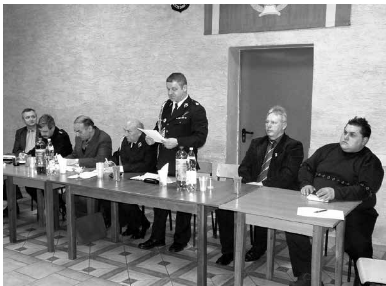
Zebranie sprawozdawcze OSP Szczedrzyk.