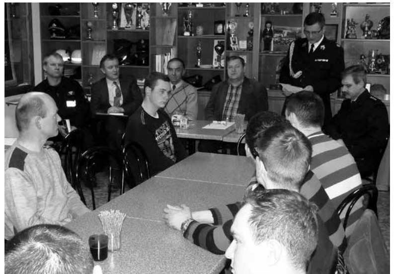
Zebranie sprawozdawcze OSP Krasiejów.

Zmartwieniem Zarządu OSP jest mały napływ nowych członków i brak pomysłów na pozyskanie młodzieży, która w przyszłości zastąpi obecnie czynnych strażaków. O ile dzisiaj nie ma jeszcze problemu z mobilnością jednostki, to za kilka-kilkanaście lat