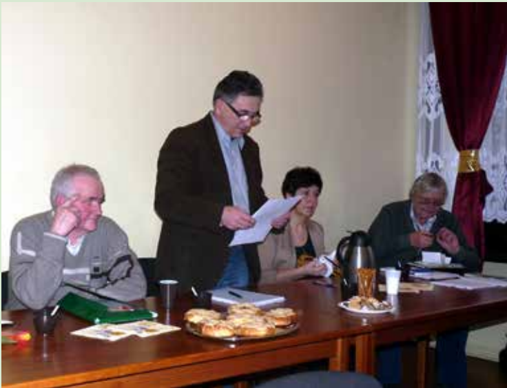
Zjazd Sprawozdawczo-Wyborczy PTTK.