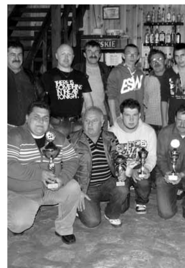
Zwycięcy ligowego sezonu „tysiaca”.

Jak podkreślają organizatorzy, liczba sympatyków tej gry, zarówno ze Szczedrzyka jak i okolicznych miejscowości, powoli lecz systematycznie rośnie. Przybywa zwłaszcza młodych graczy, wśród których zasady gry w „tysiaca” są lepiej znane od