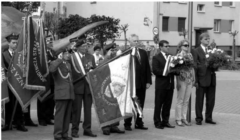
Delegacje złożyły kwiaty pod Pomnikiem Martyrologii.

Obchody 221 rocznicy uchwalenia Konstytucji 3 Maja miały w Ozimku tradycyjny charakter. O godzinie 9.30 w kościele p.w. św. Jana Chrzciciela odprawiona została uroczysta msza święta w intencji Ojczyzny z udziałem orkiestry, pocztów sztandarowych oraz delegacji władz gminy, kombatanów, młodzieży szkolnej, związków zawodowych i organizacji społecznych oraz licznie przybyłych mieszkańców.