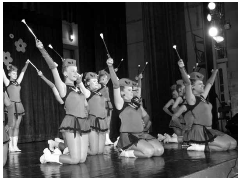
Przed mistrzostwami mażoretki wystąpiły na scenie Domu Kultury.