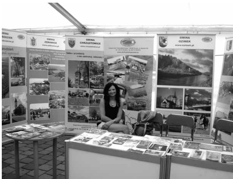
Efektowne stoisko Związku Gmin Dolna Mała Panew na opolskich Międzynarodowych Targach Turystycznych „W stronę słońca”. Więcej - w czerwcowych „WO”