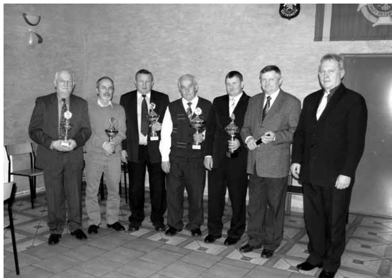
Zwycięcy rozgrywek skata sportowego sezonu 2011/2012.

Rozgrywki skata sportowego sezonu 2011/2012 organizowane przez klubu skatowe ze Szczedrzyka i Antoniowa rozpoczęły się w październiku, a zakończyły przed Świętami Wielkanocnymi. Rozegrano 27 cotygodniowych turniejów, w których sklasyfikowano 30 zawodników.