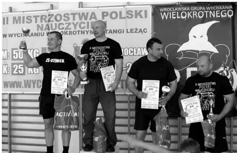
Dekoracja zwycięzców mistrzostw.

Wyciskanie sztangi na ławce leżąc to podstawowe i najpopularniejsze ćwiczenie w sportach siłowych i kulturystyce oraz wspomagające w wielu innych dyscyplinach sportowych. Nie jest co prawda jak i trójbój siłowy (wyciskanie, przysiad, martwy ciąg) dyscypliną olimpijską, jednak rosnącą popularnością i dostępnością treningu przebijają tradycyjne olimpijskie podnoszenie ciężarów (rwanie + podrzut).