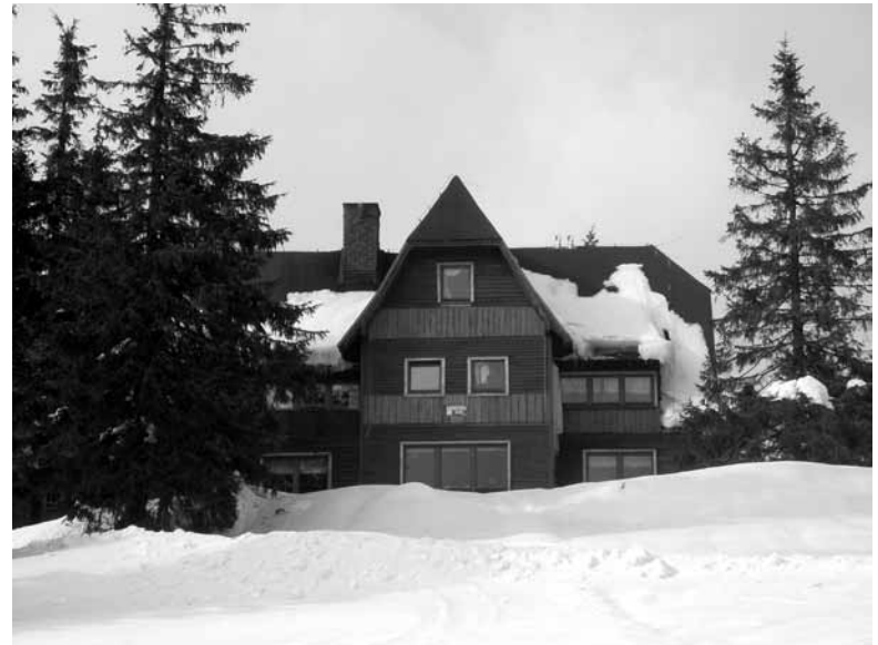
Schronisko na Rysiance w zimowej szacie.

W piękny słoneczny poranek, przy niewielkim mrozie, przez Miokołów, Tychy, Bielsko-Białą i Żywiec dojeżdżamy do Zlatnej. Końcówka drogi jest zaśnieżona i oblodzona, ale w miarę przejezdna. Szlak jest wyratrakowany, bo pokrywa śnieżna sięga 2 metrów. W bezgranicznej bieli, przy wypełnionym błękitem niebie, powolutku zmierzamy do naszego zaplanowanego celu. Podejście jest niezbyt uciążliwe, ale dosyć długie. Wchodzimy na halę pokrytą grubą warstwą zbitego śniegu. Widoki są fantastyczne,