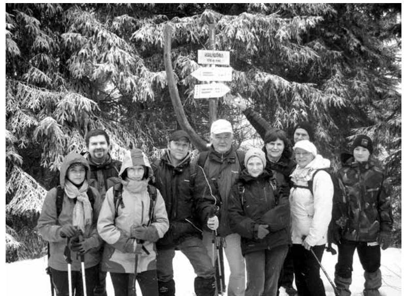
Nasi turyści na szczycie Waligóry.

W dniu wyjazdu było chłodno i pochmurno z tendencją do opa-