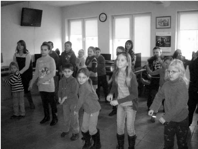
Półkolonie w Grodźcu - zajęcia taneczne.