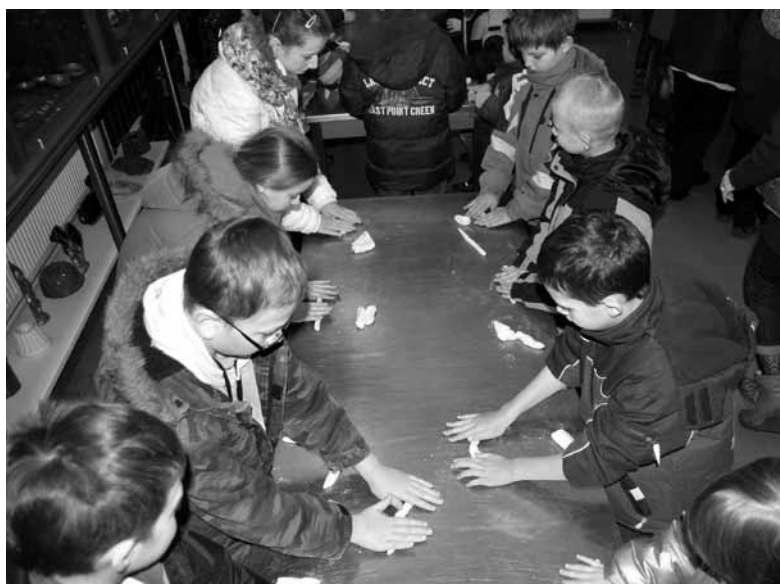
W muzeum chleba.