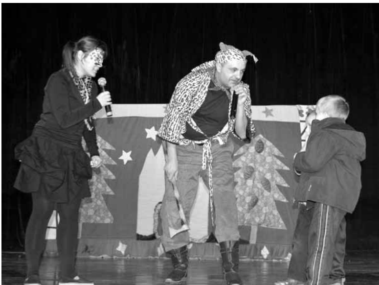
Jedną z atrakcji „Zimy w mieście” były przedstawienia teatralne.