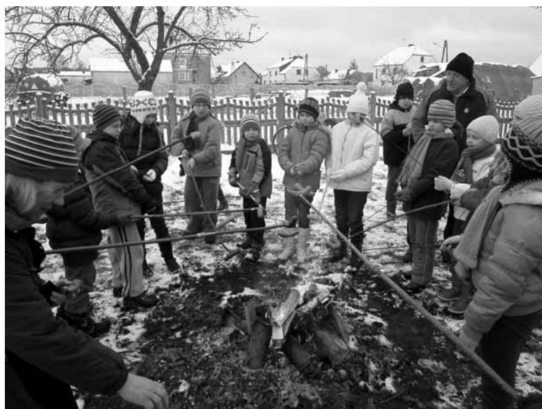
Pieczone kiełbaski były wyśmienite.