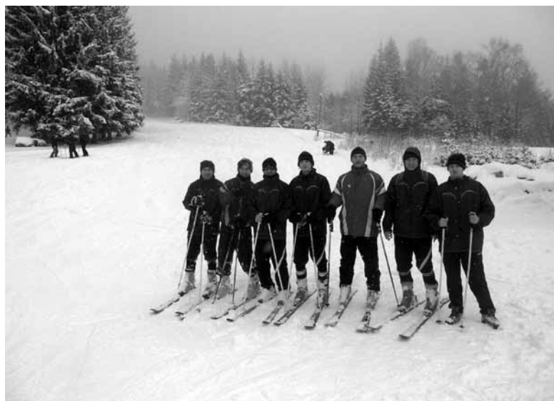
Piłkarze KS Krasiejów na obozie w Borowicach.

Piłkarze KS Krasiejów (klasa okręgowa) przygotowują się do wznowienia ligowych rozgrywek. W dniach 20-27 stycznia przebywali na obozie kondycyjno-szkoleniowym w Borowicach.