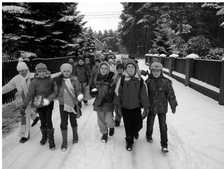
Na zimowisku w Szczedrzyku - zimowy spacer.