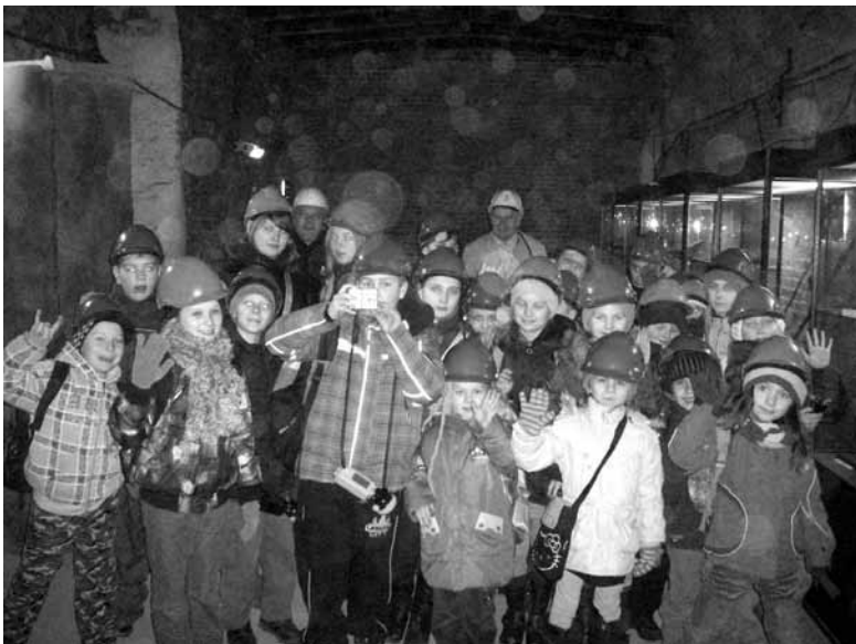
Wycieczka do zabytkowej kopalni w Zabrze.