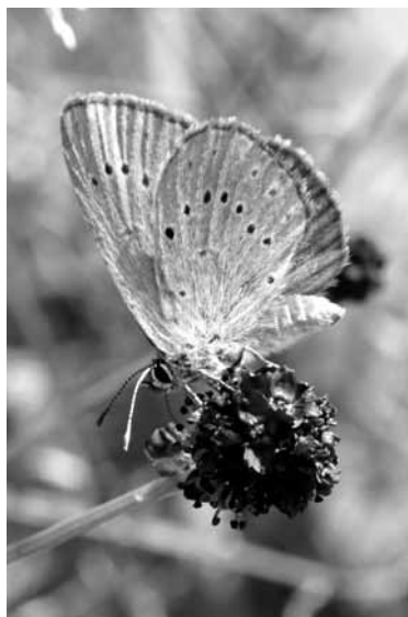
Modraszek telejus na krwiściągu lekarskim w dolinie Małej Panwi.

wydzielanych przez gatunek mrówek gospodarzy, co w większości przypadków zapewnia jej bezpieczeństwo przeżycia.