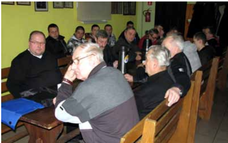
Zebranie sprawozdawczo-wyborcze OSP Dylaki.