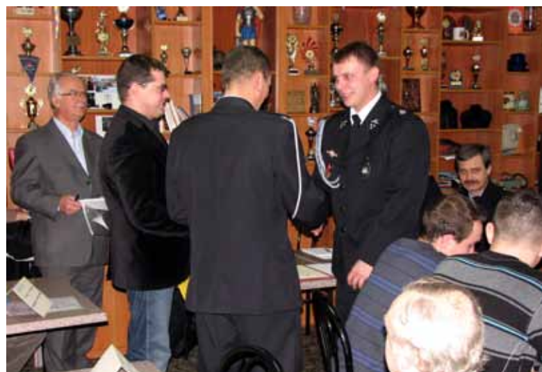
Zebranie sprawozdawczo-wyborcze OSP Krasiejów.