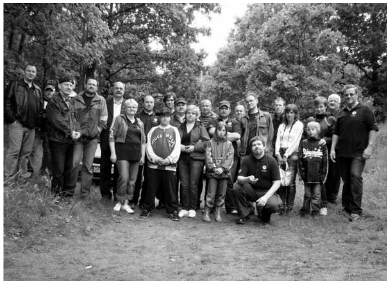
Uczestnicy zawodów na strzelnicy w Ozimku.

W sobotę 28 maja krwiodawcy zrzeszeni w klubach HDK-PCK spotkali się, na ozimskiej strzelnicy, by wspólnie rywalizować w IV Rejonowych Zawodach Strzeleckich.