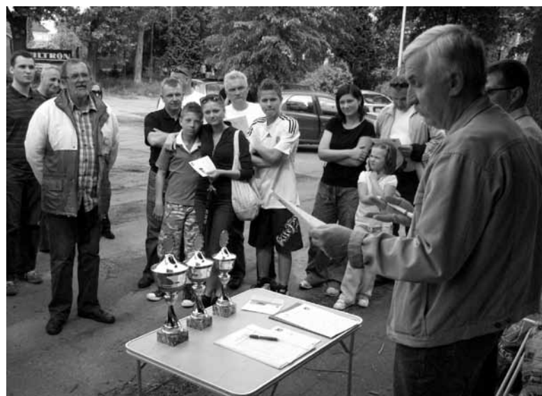
Odprawa załóg przed wyjazdem na trasę.

ci, którzy m.in. musieli zliczyć łączną sumę ograniczeń prędkości na trasie rajdu oraz znaleźć wyznaczone przez organizatorów miejsca. Emocji i zabawy było więc co nie miara, a po zliczeniu wyników okazało się, że zwy-