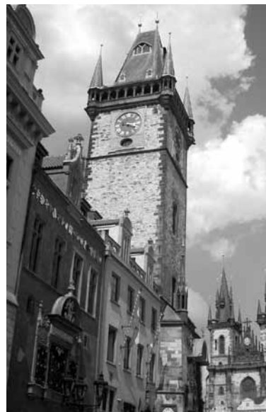
Najpiękniejsze zabytki Pragi.

W bezchmurny niedzielny poranek jedziemy bezpośrednio przez Kudowę – Słone i Hradec Kralove do Pragi. Ruch na czeskich drogach niewielki, autostrada prawie pusta, a przez okna autokaru podziwiamy piękną panoramę uprawnych