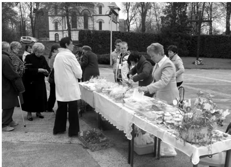
Przed kościołem odbył się kiermasz świąteczny.