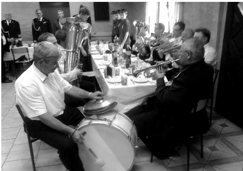
W OSP Szczedrzyk świętowano Dzień Strażaka.

Dzień swojego patrona św. Floriana strażacy - ochotnicy ze Szczedrzyku uczcili 21 maja. Najpierw uczestniczyli uroczystej mszy świętej, odprawionej w intencji żyjących i zmarłych druhów oraz ich rodziny, a następnie przeszli z orkiestrą do świetlicy przy remizie OSP, gdzie odbyła się strażacka biesiada.