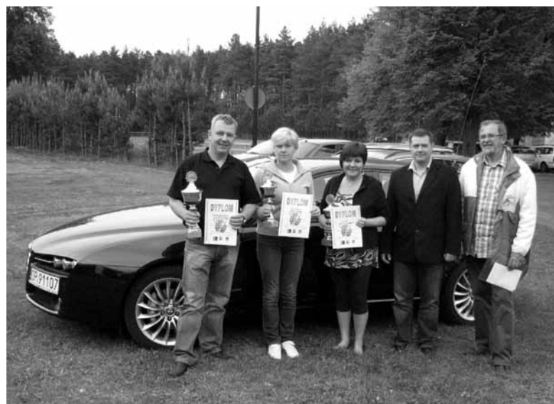
Zwycięzcy Samochodowego Rajdu Hutników.