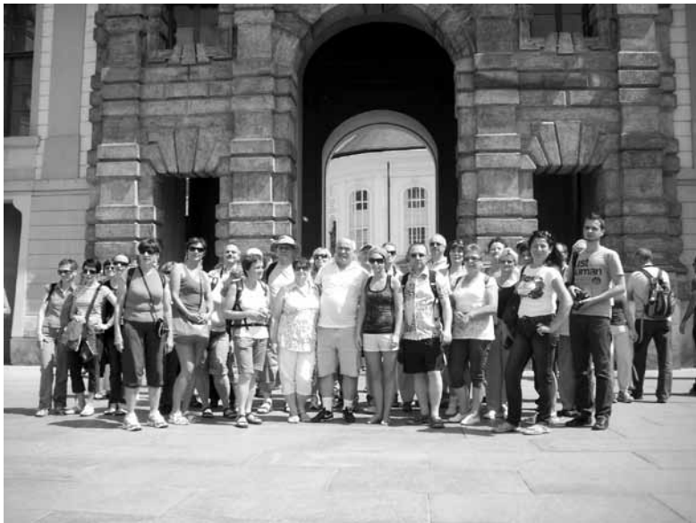
Turyści z Ozimka zwiedzali stolicę Czech.

W piękny weekend 21-22 maja KTG „Kozica” zorganizował kolejną imprezę turystyczną – tym razem dwudniową, w Kotlinę Kłodzką (Kudowa – Szczeliniec W.), połączoną z wyjazdem do stolicy naszych południowych sąsiadów – Pragi. Wycieczka cieszyła się ogromnym zainteresowaniem i wzięło w niej udział 53 turystów (komplet w autokarze).