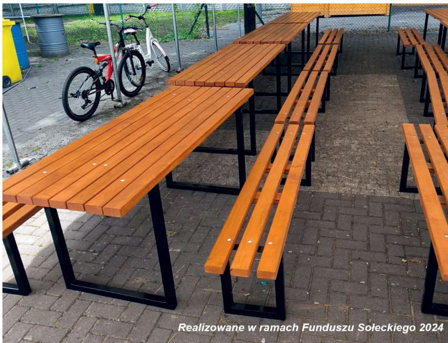
Realizowane w ramach Funduszu Sołeckiego 2024