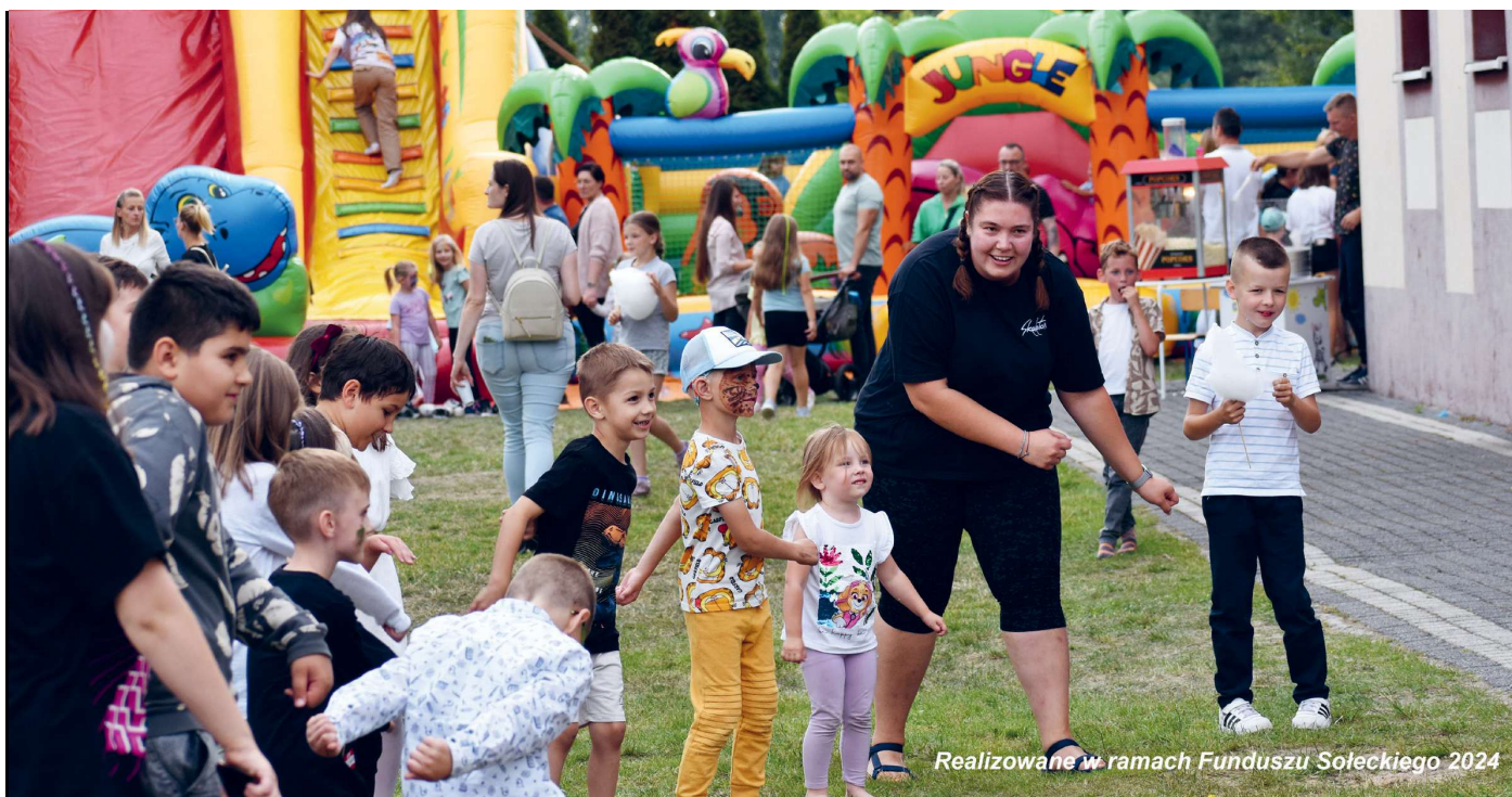
Realizowane w ramach Funduszu Sołeckiego 2024