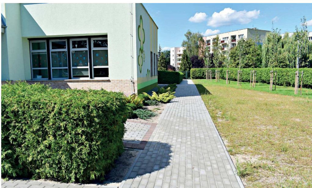
PP 2 Ozimek