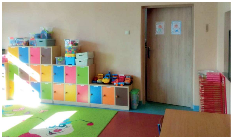
PP 6 Szczedrzyk