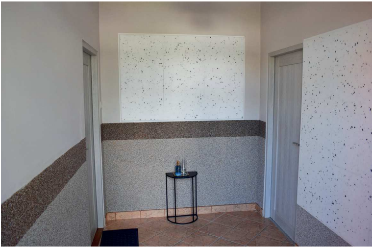
PP 3 Dylaki