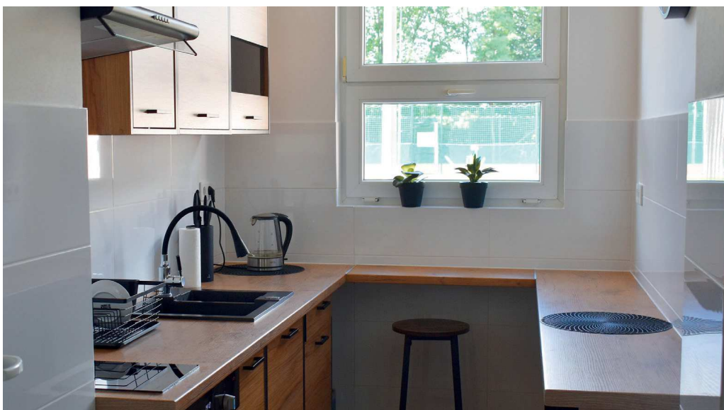
SP 2 Ozimek