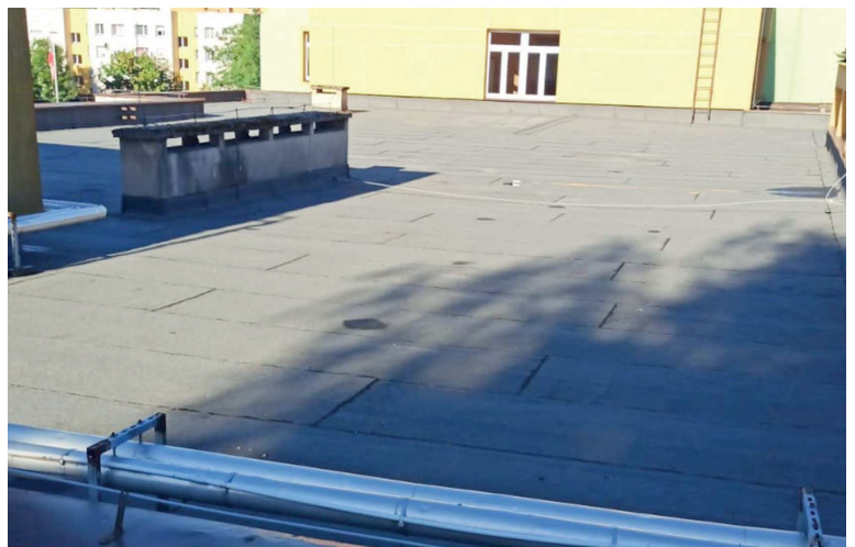
SP 3 Ozimek