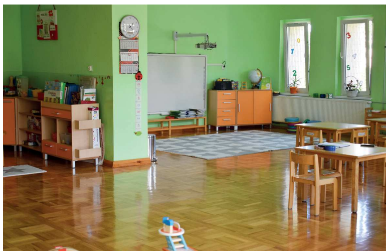
PP 2 Ozimek