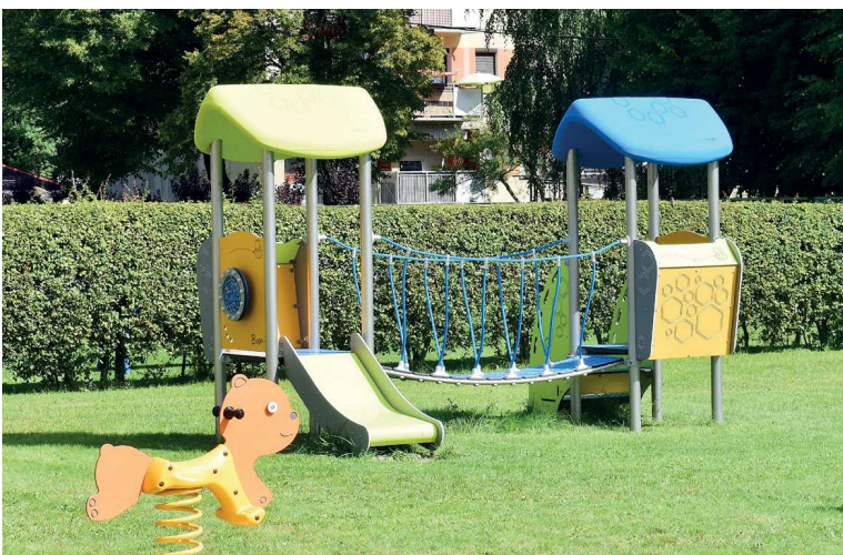
PP 1 Ozimek