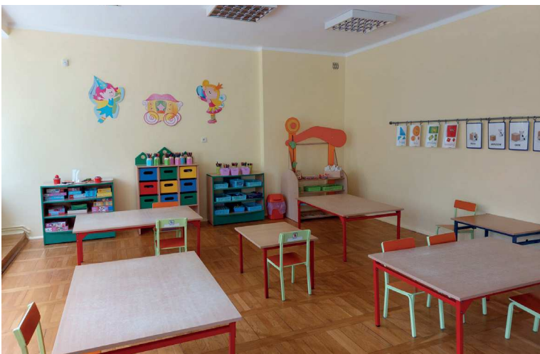
PP 4 Ozimek