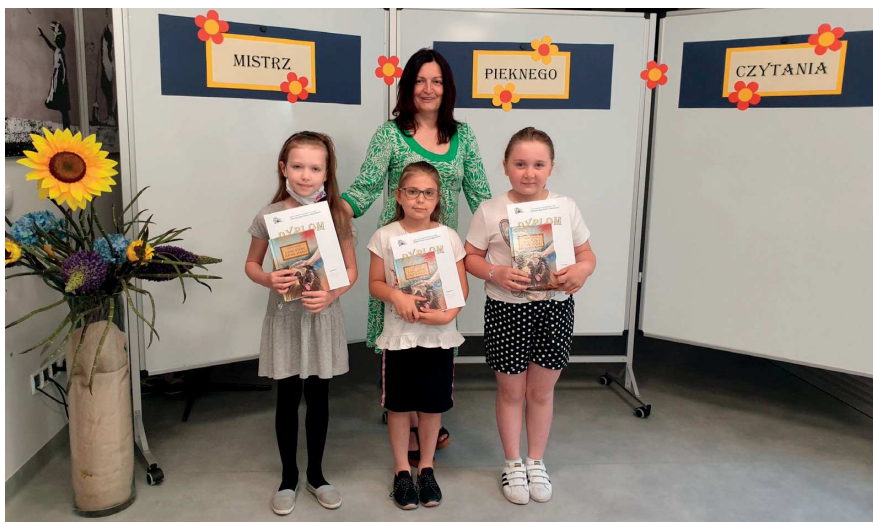
Finaliści SP nr 2 w Ozimku