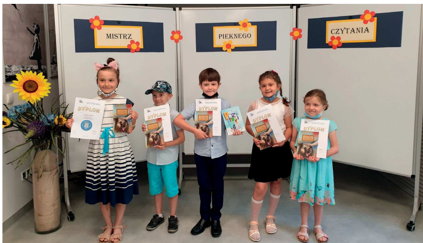
Finaliści z PSP nr 1 w Ozimku