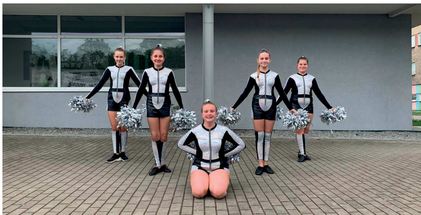
O-mega I w Opolu