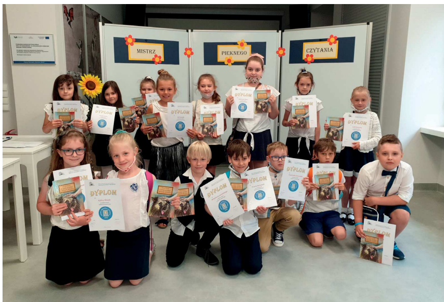
Finaliści z SP nr 3 w Ozimku