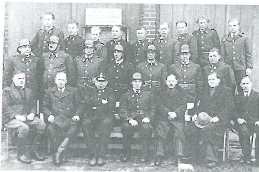
OSP Schodnia 1954

Obydwie wojny światowe oraz okres powstań śląskich przyniosły mieszkańcom wsi wiele nieszczęść i pociągnęły za sobą wiele ofiar. Na szczęście po zakończeniu ostatniej wojny większość mieszkańców mogła pozostać w swoich domostwach. Lata współczesne to powolny, ale znaczący rozwój Schodni. Staje się ona coraz piękniejsza i zasobna.