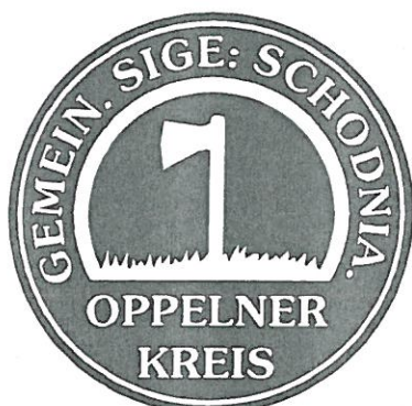
Pieczęć gminna z około 1700 roku

Z późnego średniowiecza pochodzą ślady stanowisk osadniczych na terenie wsi: fragmenty naczyń glinianych oraz grudki spieczonej rudy żelaza. Najwcześniejsza wzmianka o wsi wydaje się pochodzić z roku 1464 roku kiedy to wymieniono Schodnię jako należącą do kościoła filialnego w Krasiejowie. Pod datą 1485 roku pojawia się, wcześniej wspomniana nazwa Wschodnia i ta data zapisana w Warszawskim Słowniku Geograficznym przez wiele lat była uważana za najdawniejszą. W 1534 roku napisano, że wieś zamieszkuje 10 gospodarzy