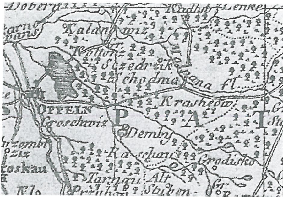
Mapa z 1746 roku

Kiedy w roku 1781 na granicy schodzieńskich gruntów i lasu, po prawej stronie rzeki, zaczęto budować kolonię Antoniów, wielu mieszkańców Schodni inaczej zaczęło spoglądać na te tereny, dotychczas użytkowane tylko jako grunty rolne.