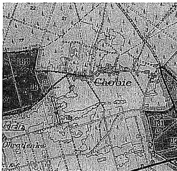
Mapa leśna 1932

Prawie wszyscy mieszkańcy byli katolikami należącymi do parafii w Szczedrzyku. Tylko 6 ewangelików uczęszczało do kościoła w Grodźcu. W roku 1894 w Chobiu wybudowana została kapliczka, poświęcona Matce Boskiej Różańcowej. Widocznie ludzie, którzy mieli daleko do kościoła, chcieli mieć swą własną, małą świątynię. Do dzisiaj odbywają się tu nabożeństwa majowe w maju i różańcowe w październiku. Raz w roku odprawiana jest msza święta w MBR, połączona z odpustem.