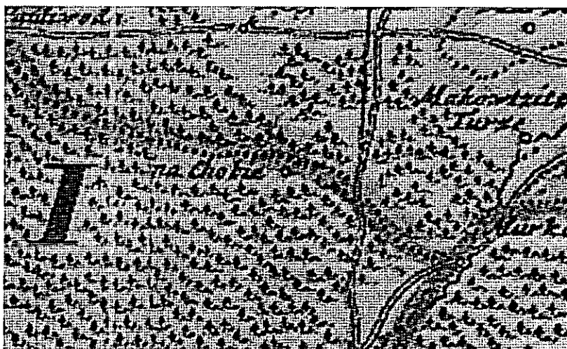
Mapa Księstwa Opolskiego z 1736

Pierwsze wzmianki na temat naszej wsi znaleźć możemy już w 1736 roku na mapie Księstwa Opolskiego. Istnieją dwie teorie nadania wiosce nazwy. Pierwsza zakłada że nazwa pochodzi od gwarowego określenia chwasty, gałęzie, korzenie, które to najprawdopodobniej otaczały zadłużony książęcy folwark. Druga teoria, według autorów niemieckich, wywodzi nazwę od jastrzębia, zwanego potocznie „Kobuch” względnie wrony – „Kuba”. 10 czerwca 1754 roku dokonano podziału ziem pomiędzy 12 okolicznych osadników, którzy zobowiązali się wybudować w tym miejscu swoje zagrody.