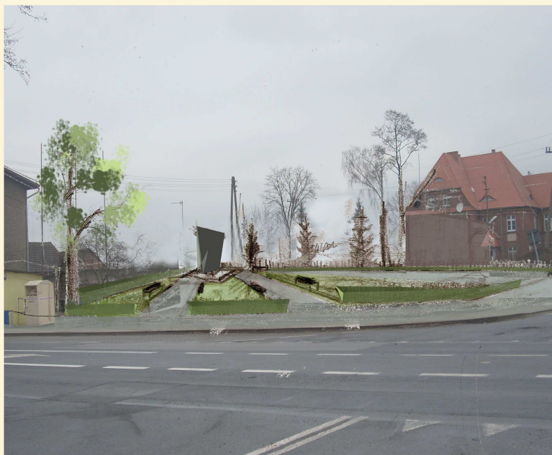
Róg ulic Częstochowskiej i tartacznej - projekt 1

Rys. 3: Centrum wsi – pomnik pamięci ofiar poległych w wojnach światowych i walkach w obronie ojczyzny.