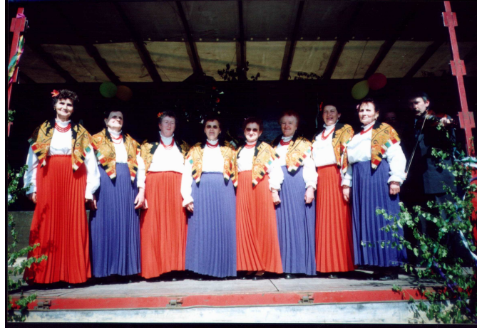
Zespół „Grodziec” podczas występu z okazji „Dni Grodzca”

„Jutrzenka” przed występem z okazji „Dni Grodzca”