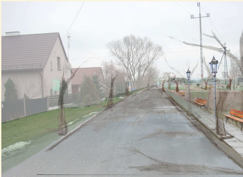
Ulica Klasztorna- projekt 3