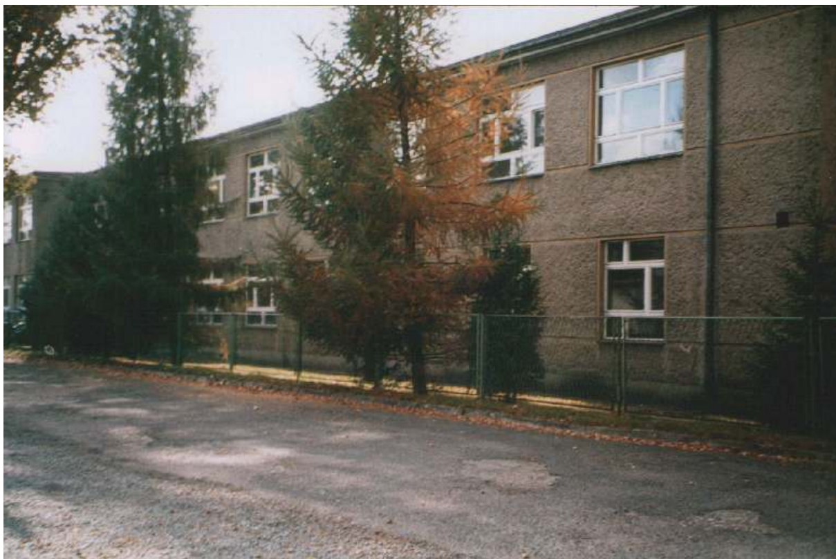
Szkoła z roku 2002.