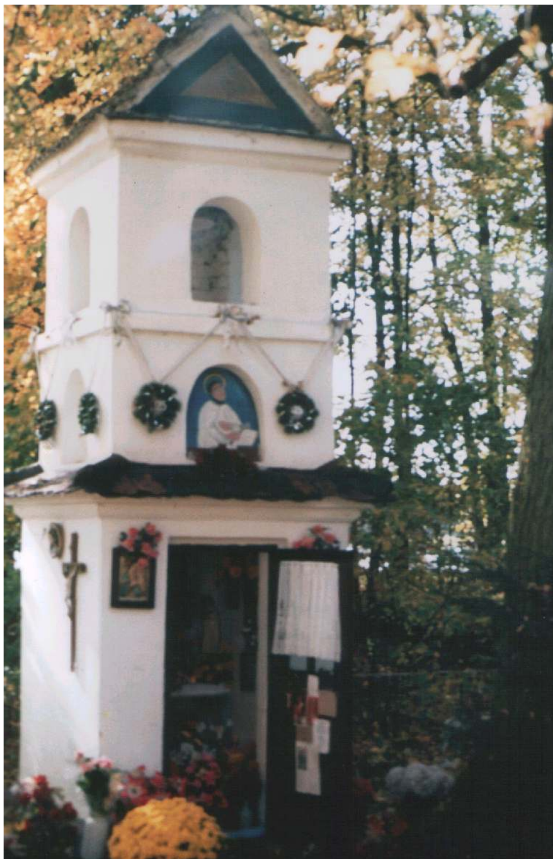
Kapliczka z XVII w.