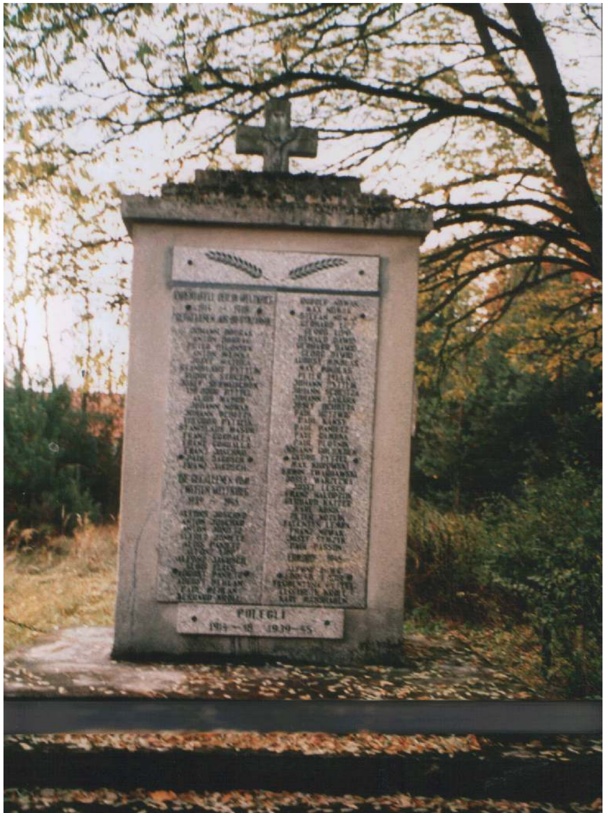
Pomnik poświęcony ofiarom I i II wojny światowej.