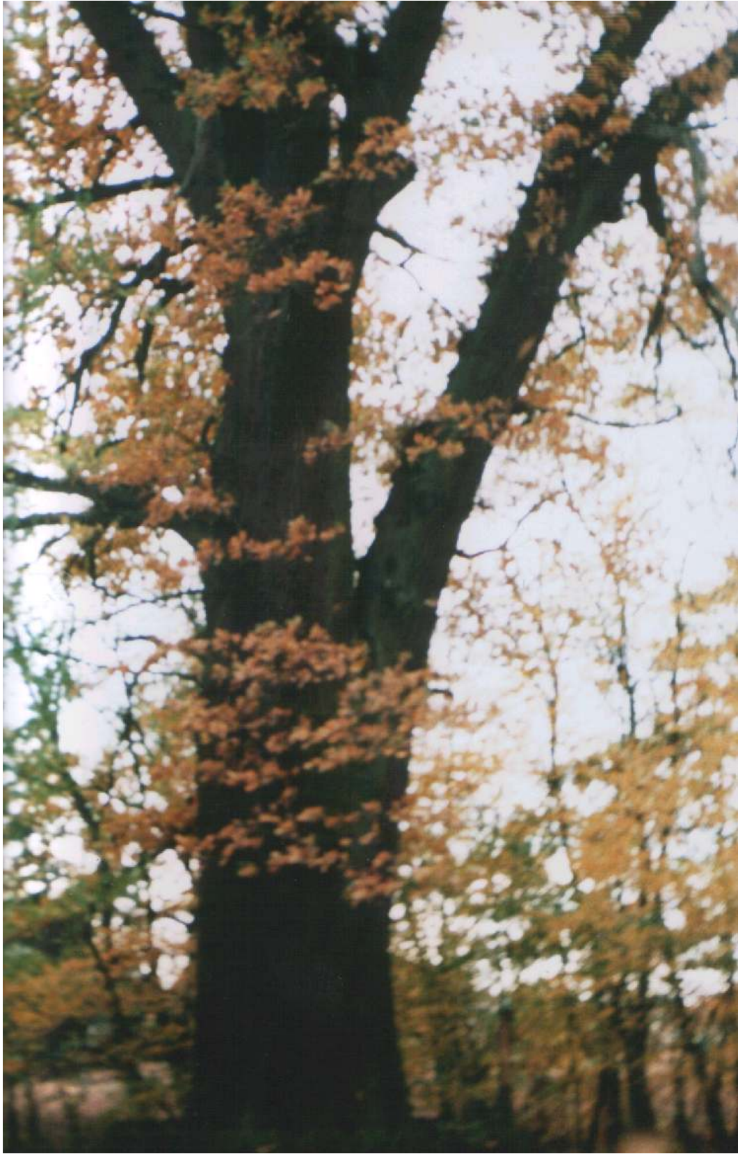
Dąb – pomnik przyrody.