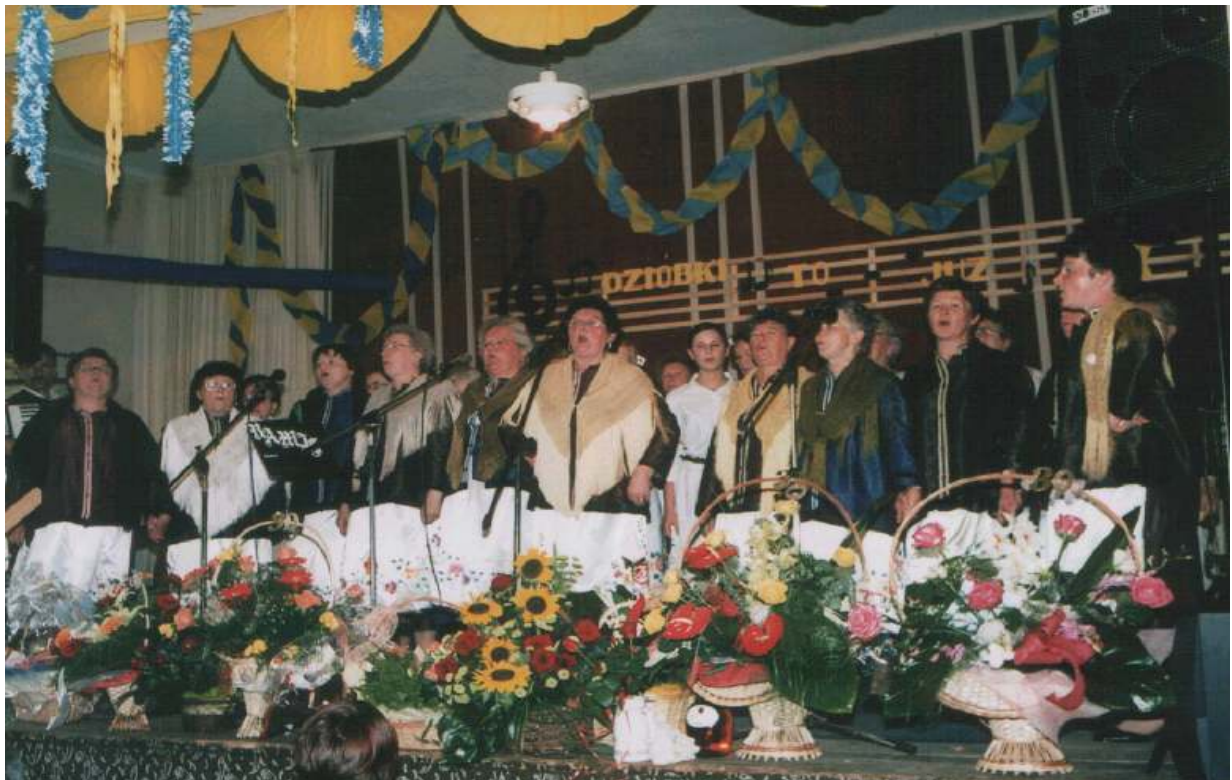
Maj 2005r. Jubileusz XXX – lecia Zespołu „DZIÓBKI”.