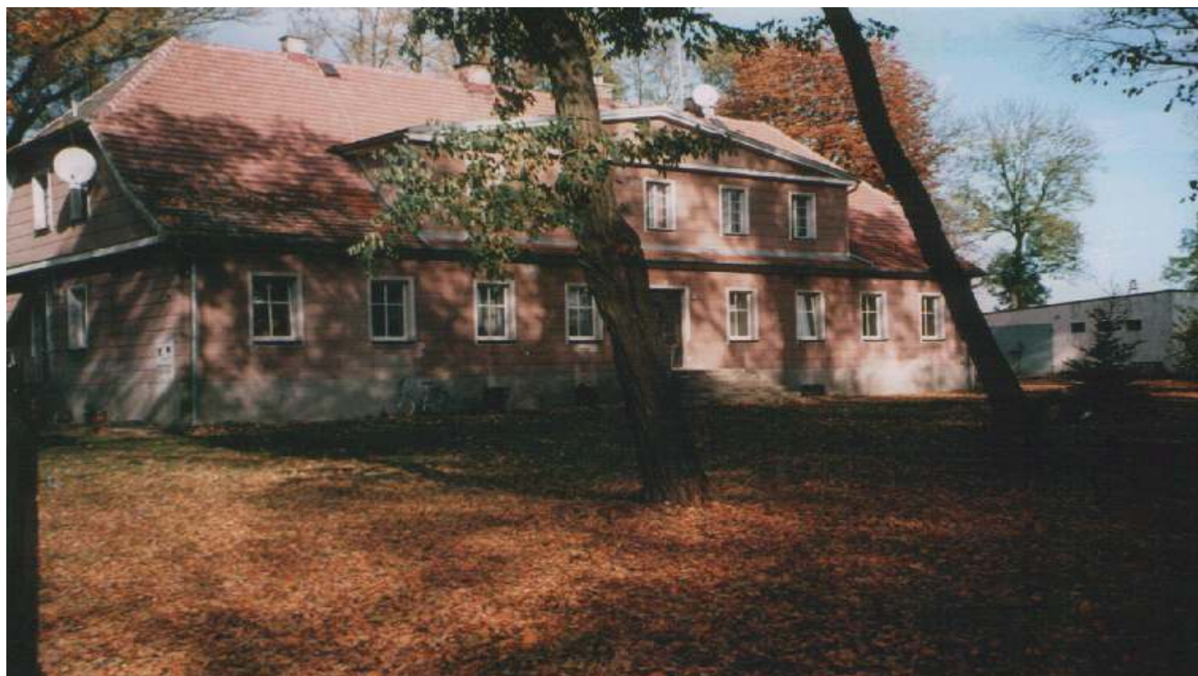
Dwór z początku XX w.