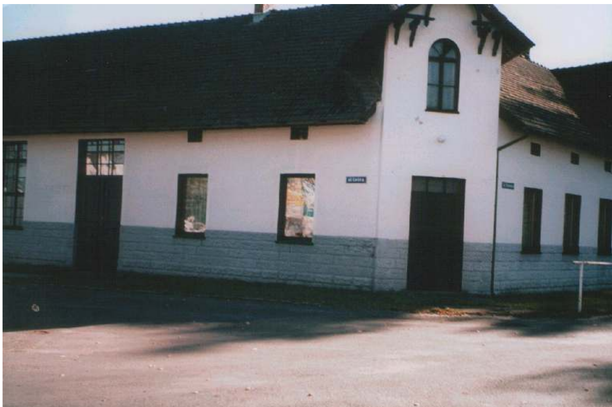
Sala z roku 2005.