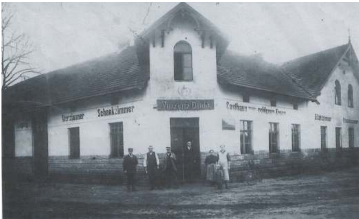
Sala z roku 1902.