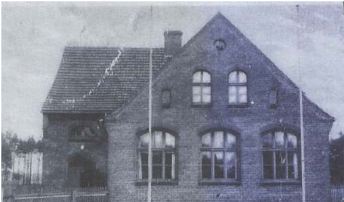
Szkoła z roku 1902.