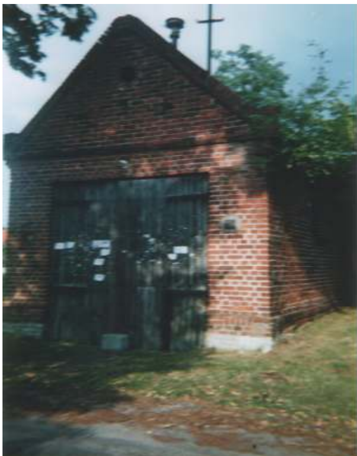
Budynek po Remizie Strażackiej (ok. 100 lat).