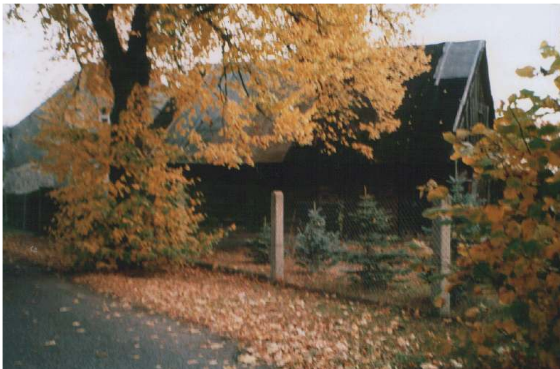
Budynek mieszkalno – gospodarczy 100-tu letni.